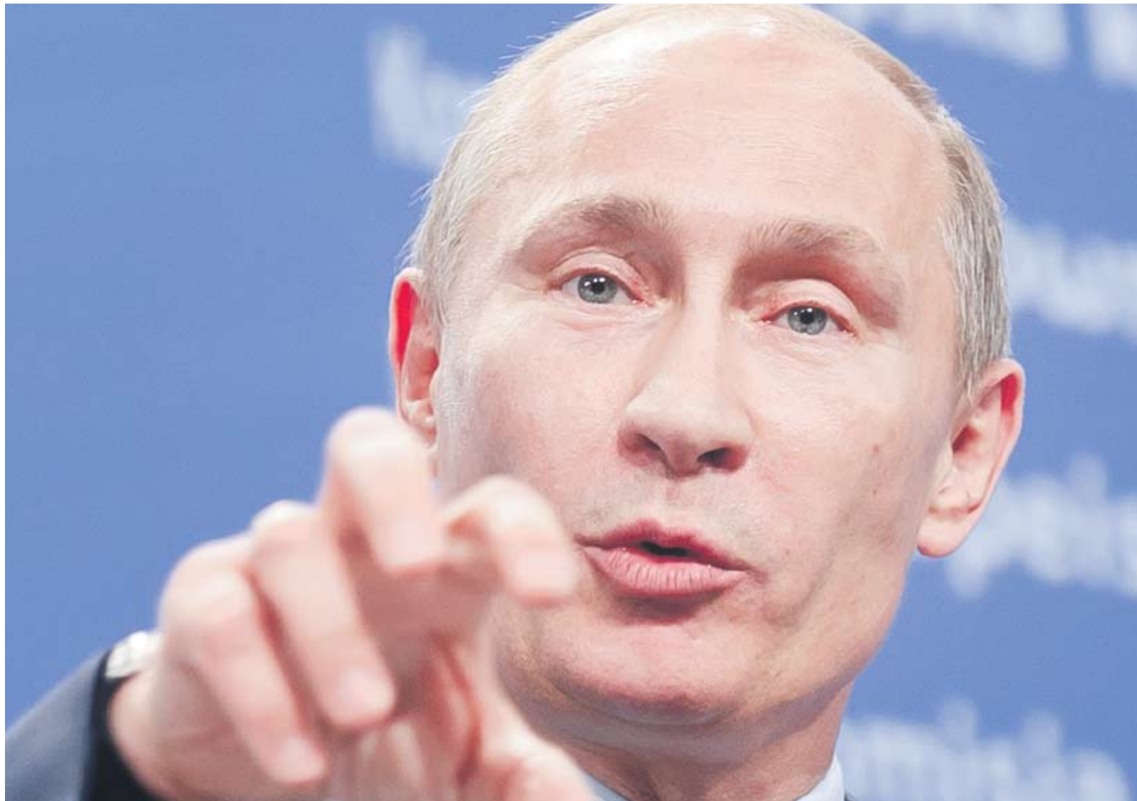
► След последните промени в конституцията Владимир Путин може да остане на президентския пост до 2024 г.

От изказването на сегашния премиер на конгреса стана ясно, че Медведев ще поеме поста му начело на кабинета след парламентарните избори на 4