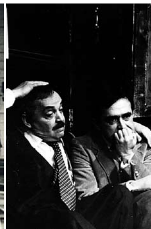
► "Максималистът", премиера през 1984 г. в Сатиричен театър "Алеко Константинов"

Стратиев е емблема на българската драматургия. Негови текстове са публикувани в редица издания, автор е и на киносценарии. Пиесите му са превеждани, издавани и поставяни в над 20 държави по света. Само в Сатиричния театър текстовете му са поставяни над 1500 пъти. Успехът на творчеството му се дължи на искрения опит да разбере човека на фона на човечеството. Целият живот на Стратиев е тясно свързан с текста и театъра. През септември се навършват 70 години от рождението и 11 години от смъртта му. По-голямата част от творческия му път преминава в салоните на Сатиричния театър "Алеко Константинов". По този повод театърът му подарява новия си сезон.