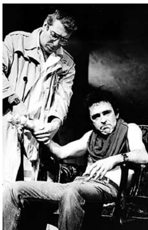
► "Животът, макар и кратък", премиера през 1986 г. Сатиричен театър "Алеко Константинов"

По повод 70 години от рождението на Станислав Стратиев Сатиричният театър подготвя програма, посветена на писателя