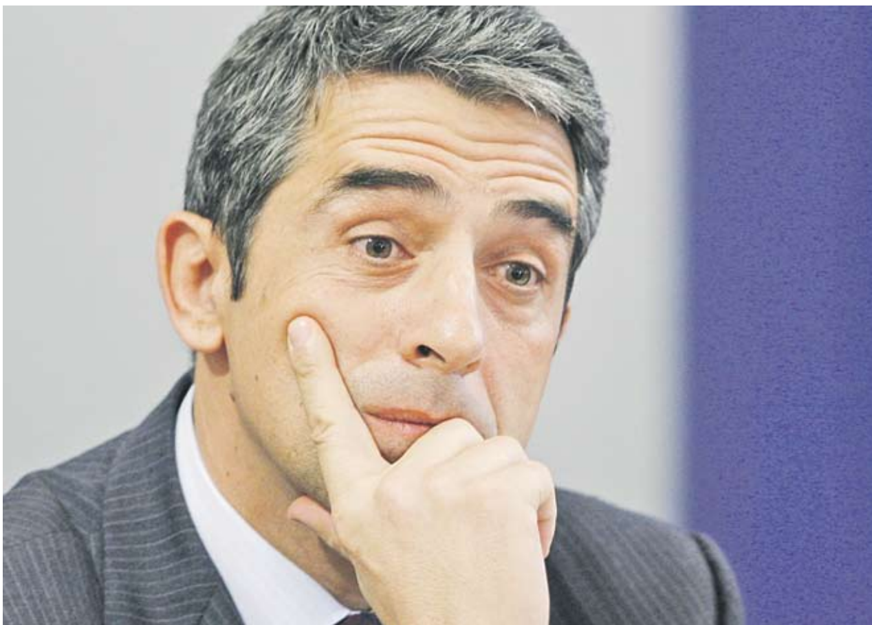
► Росен Плевнелиев е най-отразяваният от медиите кандидат-президент. Само за десет дни шест национални медиуми са му посветили общо 169 материала. Втори е кандидатът на БСП Ивайло Калфин със 100 материала, следван от независимата Меглена Кунева и Румен Христов от Синята коалиция с по 36