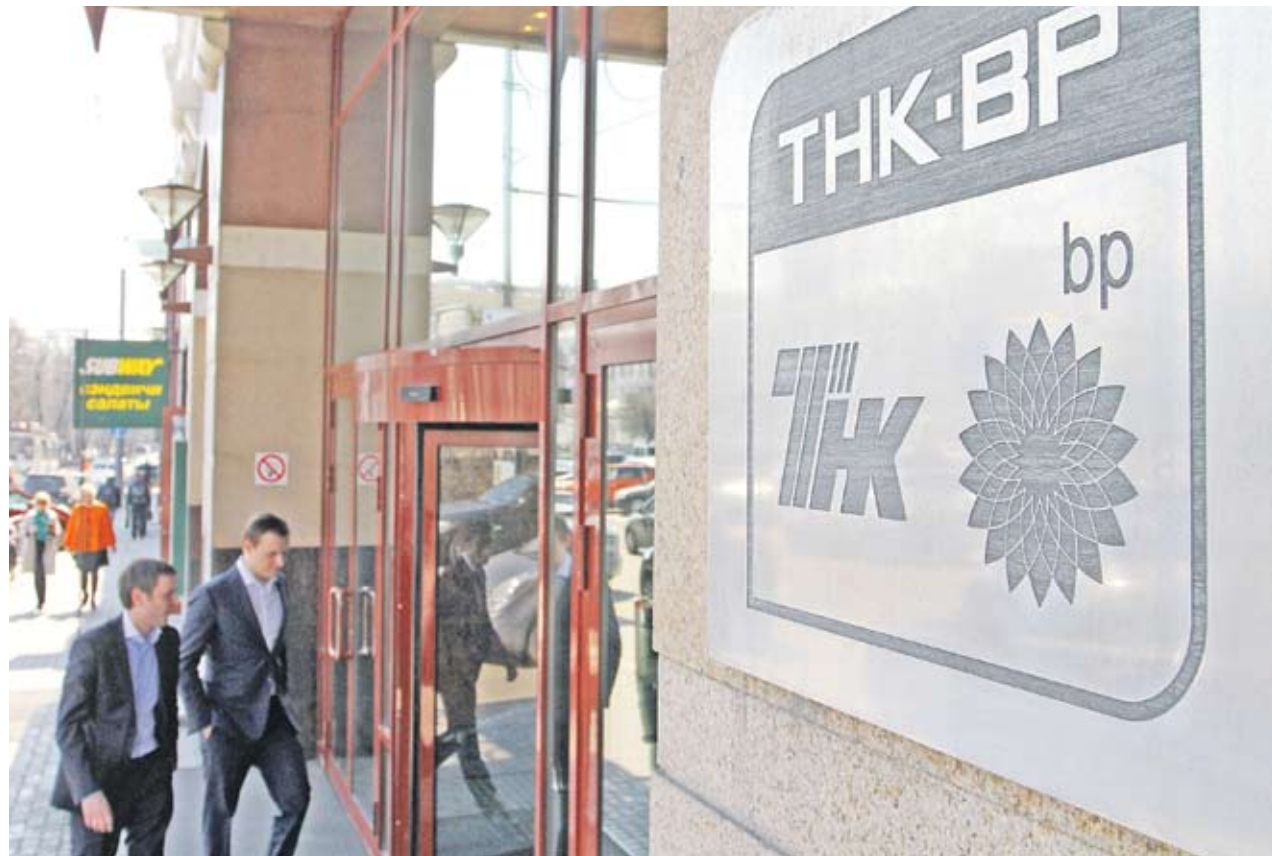
► Служителите в московските офиси на British Petroleum бяха помолени да се приберат вкъщи, докато трае обискът

Акцията вероятно е във връзка с провалите преговори на петролния гигант с “Роснефт”