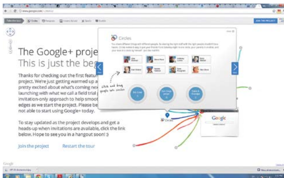
► Според някои анализатори още е рано да се правят мрачни прогнози за броя на потребителите, тъй като от Google не са отворили услугата за всички

Всеки потребител е прекарал средно 5 минути и 47 секунди в Google+ през миналата седмица, или с 4% повече от предната седмица, казват от компанията за измерване на интернет трафик. От Experian Hitwise