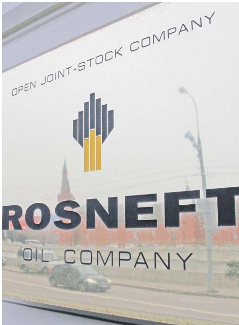
► Споразумението между Еххон и “Роснефт” е и политическа победа, пряк резултат от възстановяването на взаимоотношенията между САЩ и Русия, отбелязват анализаторите