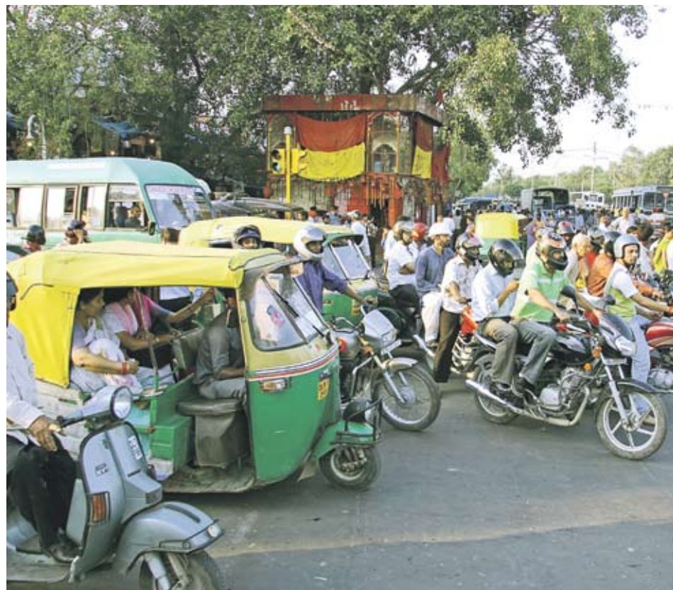
► Триколесните авторикши са символ на индийската столица