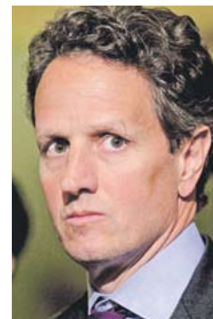
Тимоти Гайтнър, министър на финансите на САЩ

Standard&Poor's се държат много лошо. Показаха учудващо непознаване на основната аритметика на американския бюджет