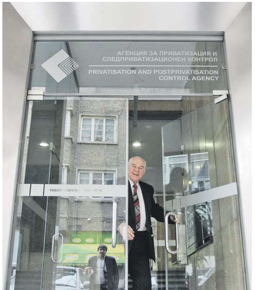
▶ Агенцията за приватизация и следприватизационен контрол предвижда специални условия към кандидатите за миноритарните дялове