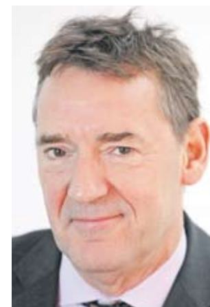
Джим О'Нийл, ръководител на Goldman Sachs Asset Management

Не съм сигурен дали тази новина наистина е толкова важна в краткосрочен план. Символично това вероятно наистина е тежък удар за престижа на САЩ. Дали обаче понижаването на кредитния рейтинг ще доведе до проблеми с американските облигации? Съмнявам се