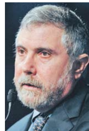
Пол Крузман, носител на Нобелова награда за икономика

Твърдо съм уверен, че Standard&Poor's е действала по политически причини. Те искат да направят услуга на някого и просто не допускат фактите да им пречат. Това, което ще бъде наистина болезнено през идните седмици, е да се наблюдава как "наистина сериозните хора" се отнасят с тези клоуни така, сякаш мнението им струва нещо