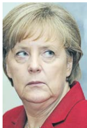
Ангела Меркел, канцлер на Германия

Всички финансови пазари, всички играчи на финансовите пазари и финансовите инструменти трябва да бъдат подложени на съответния контрол и регулация