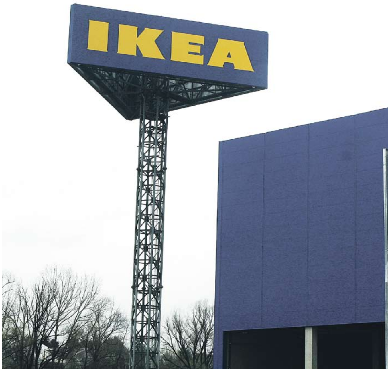
▶ От ИКЕА очакват, че до 15 септември ремонтът на Околовръстното шосе с разширения достъп до магазина трябва да бъде завършен.