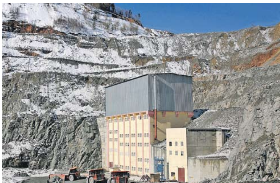
► Корпусът за едро трошене в рудник „Елаците“ е спестил 4300 т емисии въглероден диоксид само през миналата година