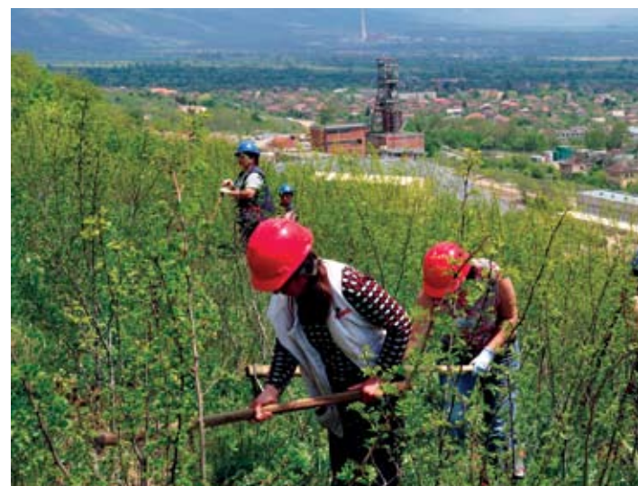
► Проектът „Гората на „Челопеч майнинг““ предвижда Букова гора, пострадала от пожар

общество без достъп до минерални ресурси. Всъщност използването им датира още от времето на каменните оръдия на труда, керамичните съдове и първите метални предмети. Днес минералните ресурси са задължителни за развитието на всички отрасли на икономиката. Без тях са немислими строителството и химическата промишленост, електрониката и електротехниката, автомобилостроенето и космонавти-