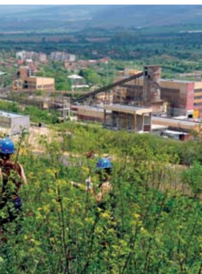
Възстановяването на 20 гка