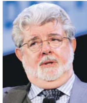
Губещ Джордж Лукас