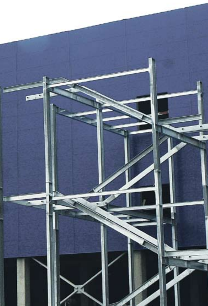
Оба да бъде завършен