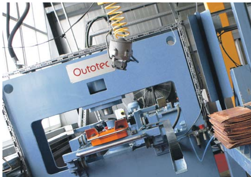
► В новата инсталация на „Асарел-Медет“ се произвежда мед с висока чистота

Наскоро „Асарел-Медет“ приключи успешно програма на стойност 24 млн. лв. за отстраняване на стари екологични щети с откриването на трета пречиствателна станция на територията на завода. Нова пречиствателна станция за отпадни води през 2010 г. беше въведена в експлоатация и в рудник „Елаците“, а друго такова