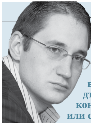
Георги Ангелов ikonomika.org

” Не бива обаче налагането на закона да прераства във война на държавата с конкретна фирма или с чужда страна