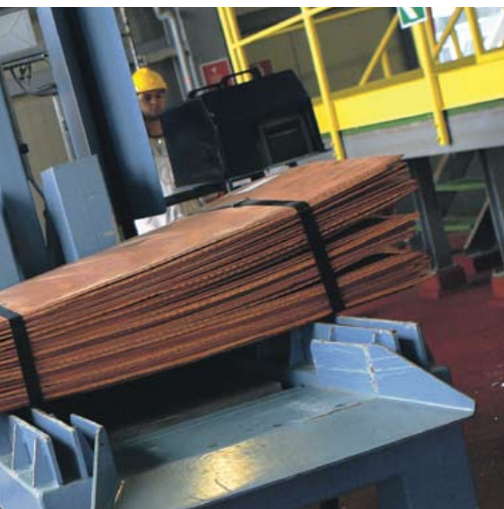
от отпадни води