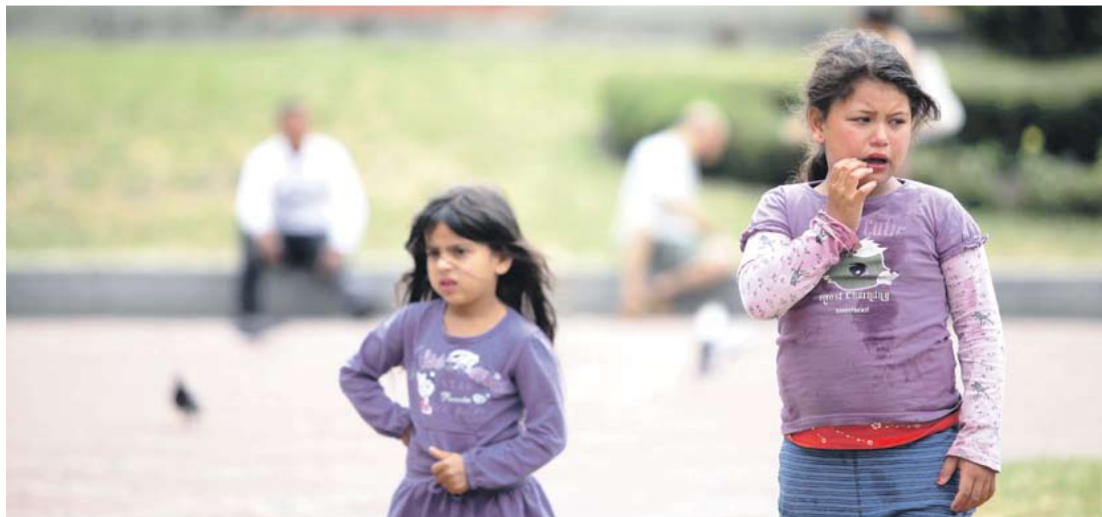
► Проблемът с образователната интеграция на децата от етническите малцинства не е въпрос само на средства, а и на контрол