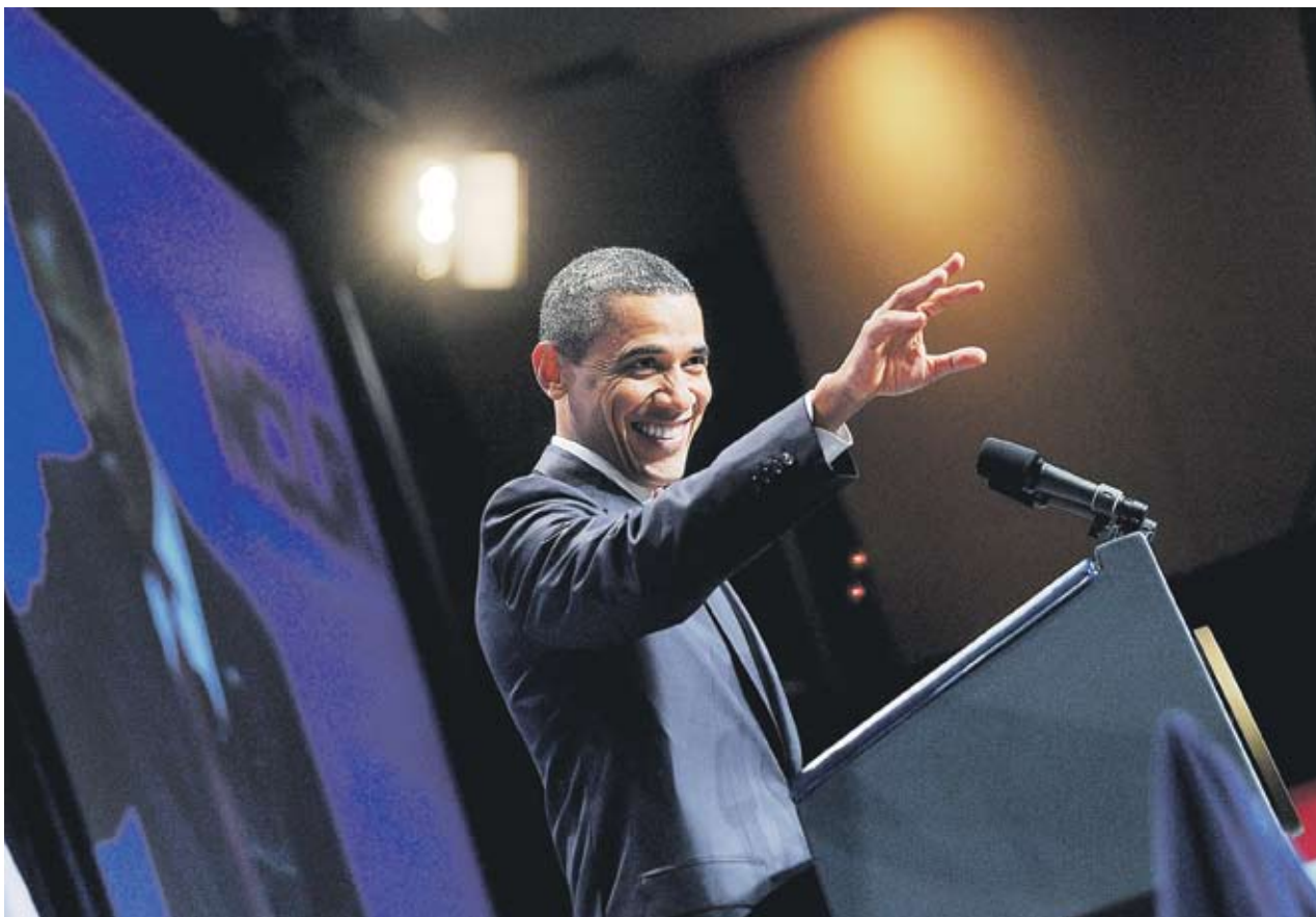
► Барак Обама призова милионерите и милиардерите да се откажат от данъчните си облекчения

"Не можем да позволим американският народ да стане странична жертва на политическата война във Вашингтон", заяви Обама в обръщение към сънародниците си, в което упрекна републиканците, че не отстъпват от позициите си за резки бюджетни съкращения. В изявлението си американският президент настоя милионерите и милиардерите в страната да се откажат от данъчните