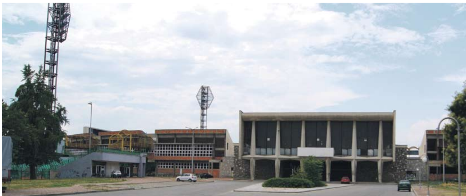
Проектът е за комплекс „под един покрив“ на футболен стадион за 25 000 зрители, 100 000 кв. м търговски площи, 3500 места за паркиране

„Мисля, че Пловдив няма финансовата възможност сам или с подкрепата на държавата да осъществи сега подобен проект на стойност 159 млн. EUR“, каза Габриел Серда - генерален мениджър на архитектурно бюро „Грас“. „За това считаме, че най-вероятният вариант за реализация е публично-частно партньорство, в което инвеститорите събират старото съоръжение и изграждат новите, срещу което получават собствеността на комерсиалната част от комплекса, а общината - спортните съоръжения“, обясни още Габриел Серда. Той каза, че екипът му работи с кръг от испански и