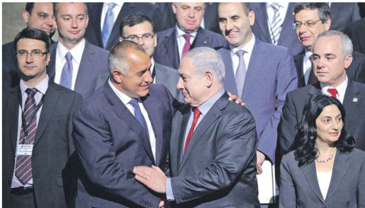
► Премиерите на България и Израел Бойко Борисов и Бенямин Нетаняху след съвместното заседание на двете правителства в София. Темите са били енергетика, сигурност, земеделие и туризъм