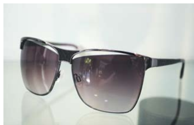
► Trussardi Ретро очила с кожа в розово. Отиват на по-тясно лице. 430 лв.