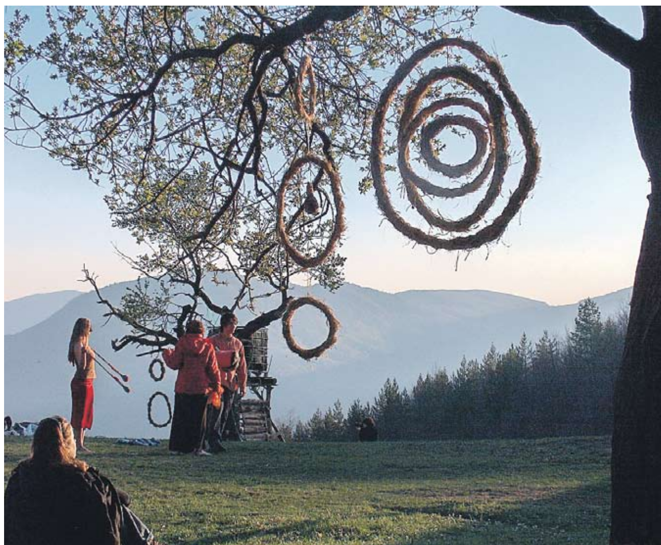
► За посетителите на Artmospheric Festival освен музика ще има работилници, уъркшоп зона и много други занимания

Първата е български демонстрационен, образователен и информационен център, който се ръководи от принципите на пермакултурата - съвкупност от методи за устойчив дизайн, който наподобява максимално естествения. WWOOF е световна организация, създаваща възможности за доброволци на органични ферми. Целите на организацията са да предложи опит и помощ при занимаването с органично земеделие, както и да стимулира развитието му.