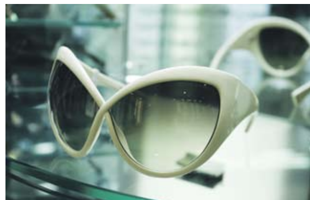
► Tom Ford Футуристични очила тип "котешко око". Отиват на по-тесни и слаби лица. 540 лв.