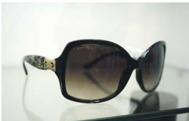
►Bvlgari Ретро очила с флорални елементи. Отиват на всяко лице. 450 лв.

4 Смалете носа За да изглежда носът ви по-малък, изберете слънчеви очила с големи рамки и по-нисък мост, за да се запази акцентът върху стъклата, а не върху носа. Нека мостът между стъклата не е прав, а извит надолу.