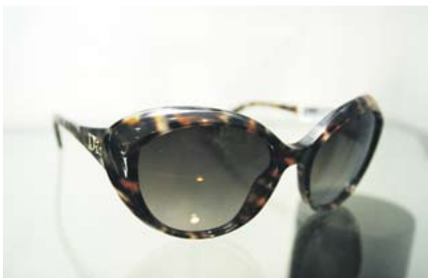
►Dior Тип "Жаклин Кенеди", с тигрови рамки. Отиват на всяко лице. 520 лв.