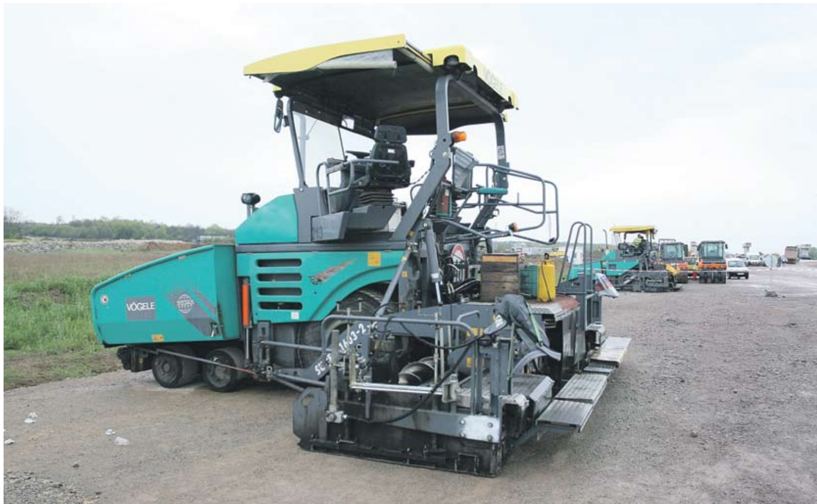
► Оскъпяването на последния етап от строителството на магистрала "Тракия" се очаква да бъде до 15 млн. лв.

Плевнелиев определи цената на "Главболгарстрой" като "кризисна, но пазарна". Според него, като се вземе предвид и ДДС, цената на километър влиза в рамките на нормалното. Той отдаде ниската цена на това, че фирмата разполага с кариери за инертни материали