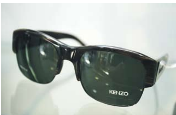
► Kenzo Унисекс, ретро очила с рогови рамки. Отиват на всяко лице. 430 лв.