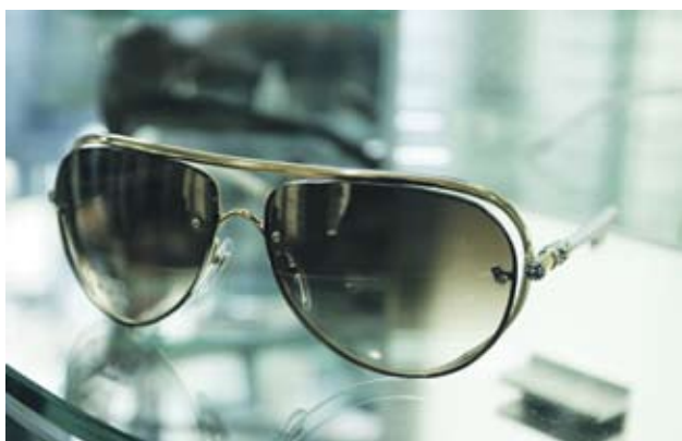
► Dior Унисекс очила с огледални стъкла. Отиват на по-едри и кръгли лица. 680 лв.