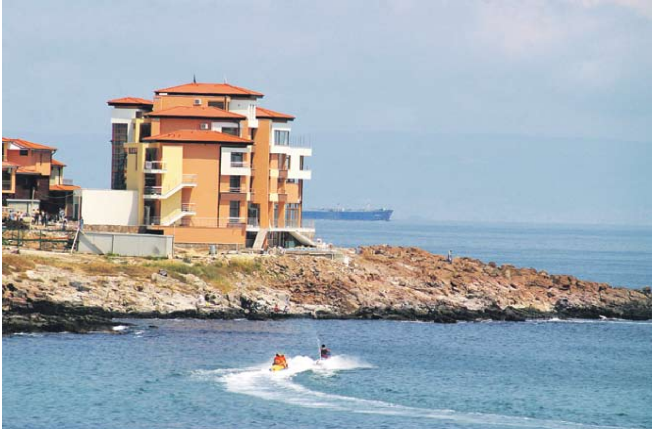
► Руснаците вече предпочитат да купуват ваканционни жилища по Южното, а не по Северното Черноморие

Повече от половината сделки са с апартаменти в най-ниската ценова категория, а над 95% от продажбите в района на Слънчев бряг са осъществени с рускиговорещи клиенти. „Това показва, че интересът на руснаците се е изместил от традиционно харесвания от тях район на Варна на юг най-вече поради липсата на ценова гъвкавост на продавачите от района на Варна“, коментира Стойкова. Причините за това са разнородни, но най-важната е липсата на толкова масивно презастрояване в този район в сравнение с района на Слънчев бряг, твърдят от „Бългериан пропертис“. Интересът към курортите по Северното Черноморие остава по-слаб, като продадените ваканционни апартаменти са на цени до 30 000 EUR. През изминалите месеци има активизация на покупката