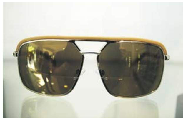
►Chrome Hearts Унисекс, ръчна изработка, с италианска кожа и сребърни елементи, позлатени. Отиват на всяко лице. 3550 лв.