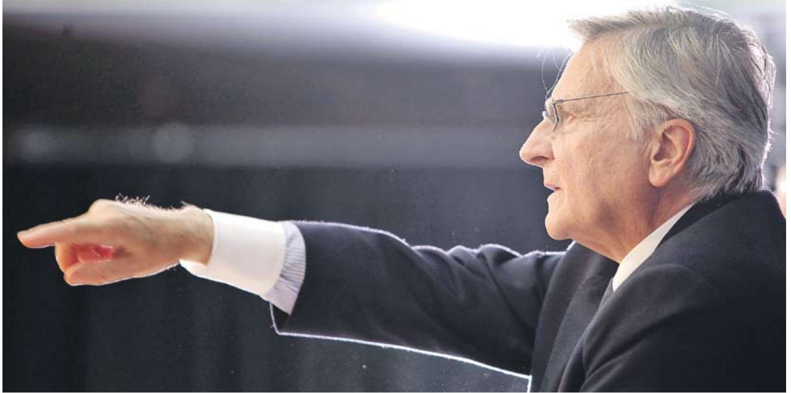
▶ Президентът на Европейската централна банка Жан-Клод Трише обяви вчера "пауза" в покачването на лихвите

На редовния брифинг след вчерашното заседание на комитета по парична политика на ЕЦБ президентът на банката Жан-Клод Трише обяви "пауза" в покачването на лихвите, предаде AP. Той отново изтъкна, че второто за годината повишаване на лихвата е взето заради нарастващия инфлационен натиск в еврозоната. Дълговата криза в редица страни от еврозоната обаче блокира политиката на банката към повишаване на лихвите, тъй като по-скъпите пари са "подарък" за почти парализираните икономики на държави на прага на фали-