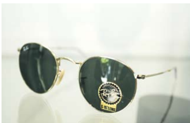
► Ray-Ban Унисекс очила тип "Джон Ленън". Отиват на всякакви лица. 330 лв.