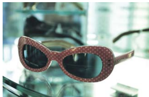
► Marc Jacobs Ретро очила с дебели, цветни рамки. Отиват на по-тесни лица. 400 лв.