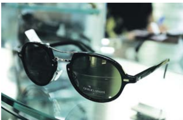
► Giorgio Armani Мъжки очила с кръгли рамки тип "мотоциклетист". Отиват както на широки, така и на тесни лица. 380 лв.