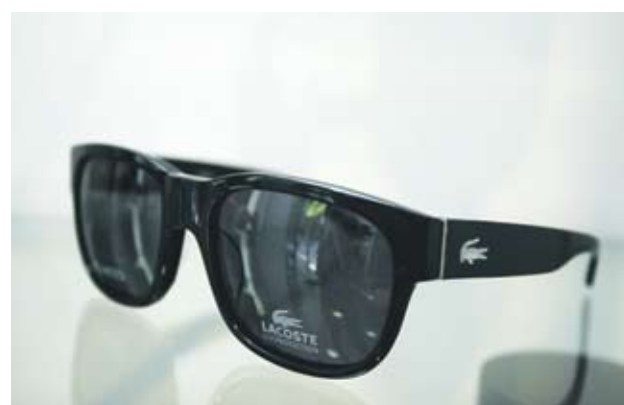
► Lacoste Унисекс, класически ретро очила. Следват стила на Wayfarer. Отиват на всяко лице. 320 лв.

► По-тъмните стъкла невинаги означават по-добра защита. По-леко оцветените стъкла предлагат по-добра видимост. Стандартното оцветяване на слънчевите очила е 75%. За градски условия са подходящи и само 50%. Но дори и при тях UV филтърът е задължителен. За планина оцветяването трябва да е 90%, но такива очила се правят само по поръчка.