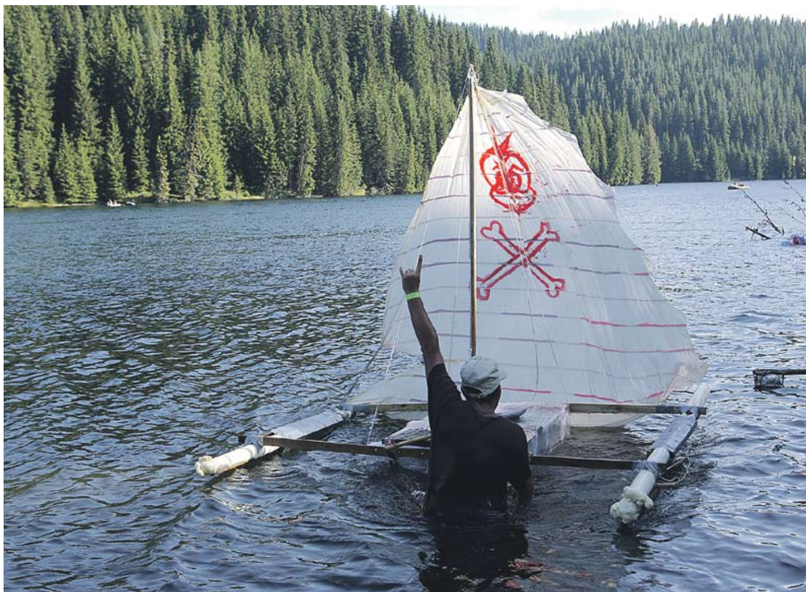
► Беглика Фест се провежда край язовир "Голям Беглик"

Екофестивалите стават все по-често явление у нас