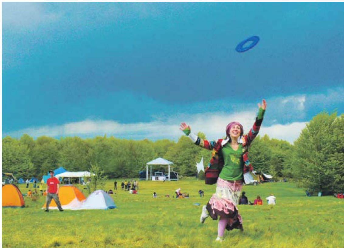
► Всички организатори на екофестивали са единодушни - най-доброто място за тях е в планината

Въпреки че този тип събития са несравними по мащаб с големите музикални фестивали, те имат своите предимства. Няма ги огромните тълпи и кочината, която върви с тях. За сметка на това има приятно удовлетворение, че си научил нещо и си помогнал, макар и малко, за опазването на нещо ценно. Единственото, което остава, е да грабнем раниците и билетите и да потеглим на път. А за дестинациите вижте вдясно.