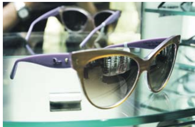
►Dior Тип "котешко око" с хамелеонови оттенъци. Отиват на по-тесни и фини лица. 350 лв.

Миналото се завръща с пълна сила в трендовете за слънчеви очила тази година