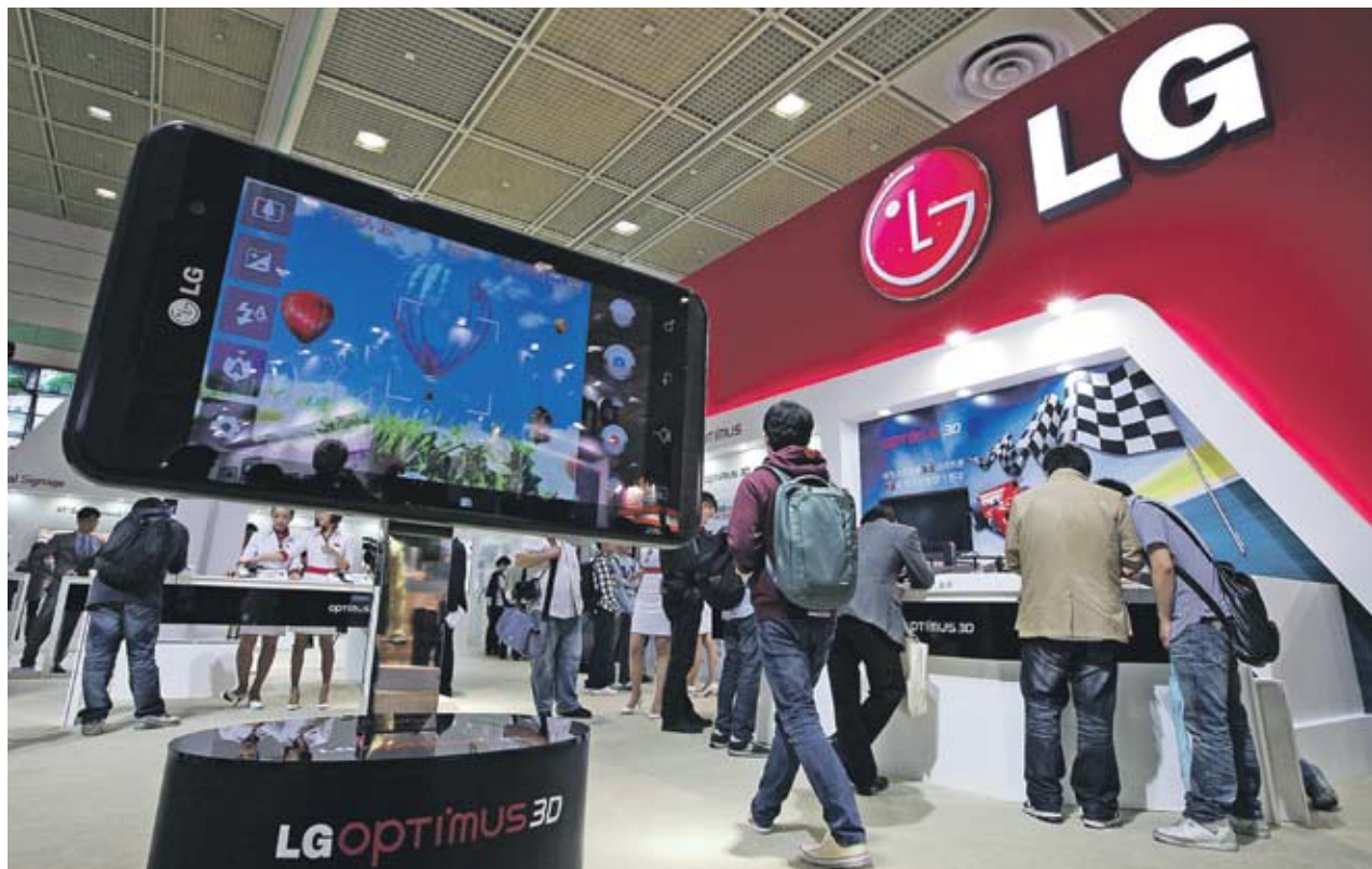
► LG бавно се преориентира към производство на смартфони, а малките мащаби на компанията й пречат да се възползва от растящото търсене на по-евтини модели

► млн. е броят на преносимите устройства, които усткам га провагат от LG през 2011 г. Преди ревизията на плановете на компанията целта бе за 150 млн. продажби