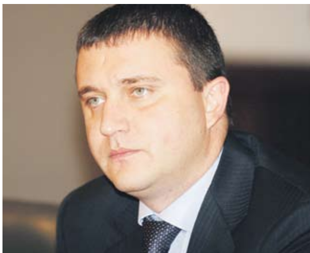
Владислав Горанов, зам.-министър на финансите

” Чрез законопроекта за публично-частно партньорство държавата се опитва да уреди един нов вид взаимоотношения по прозрачен начин