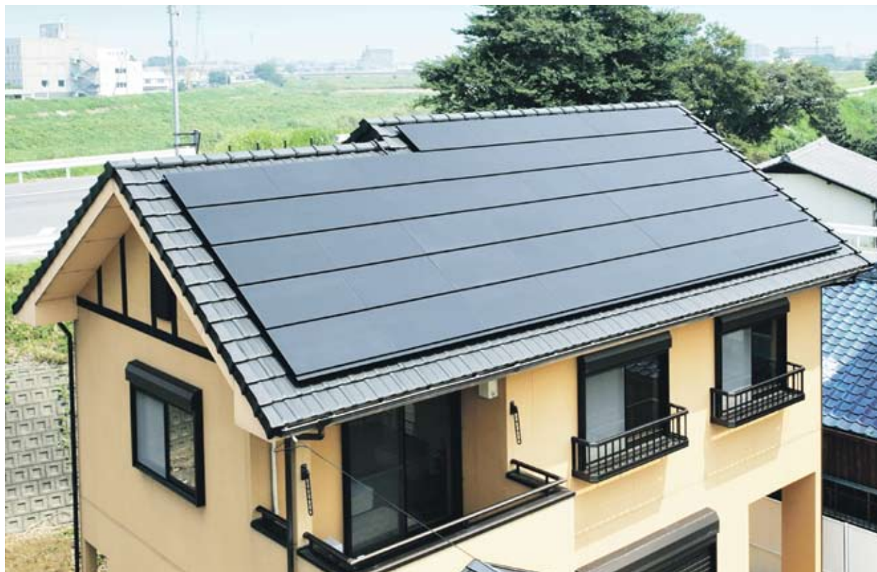
► Специалистите казват, че всеки проект за инсталиране на соларен панел на покрива е индивидуален и е трудно да се посочи цена, но поне ориентировъчно минималното вложение е около 5 хил. лв.