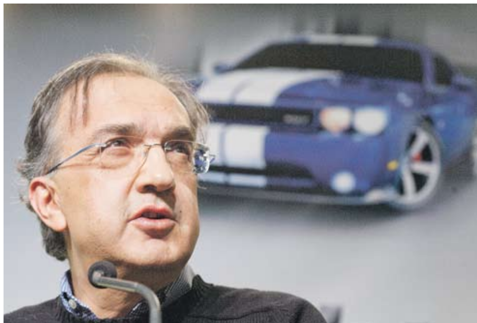
Целта на главния изпълнителен директор на Fiat Серджо Маркионе е Chrysler да регистрира нетна печалба тази година за първи път от 2009 г. ЧИМКА BLOOMBERG

години по-рано от предвиденото. Той цели да увеличи дела на Fiat до 46% през второто тримесечие, след като завърши транзакциите за изплащане на заемите в размер на 7.5 млрд. USD, които Chrysler е получил от правителствата на САЩ и Канада. След това Маркионе, който е директор и на Chrysler, иска да увеличи дела на Fiat до 51% до края на 2011 г. в подготовка за стартиране на първично публично предлагане на базираната в Мичиган компания. Целта на Маркионе е Chrysler да регистрира нетна печалба тази година за първи път, след като излезе от банкрут през 2009 г. За това той е подкрепен от администрацията на президента Обама. Срещу размяна на технологии, управление и постигането на определени цели американското и канадското правителство дадоха на Fiat 35% дял в Chrysler, без да се налага италианската компания да плаща за тях. В момента Fiat държи 30% от американската компания. П