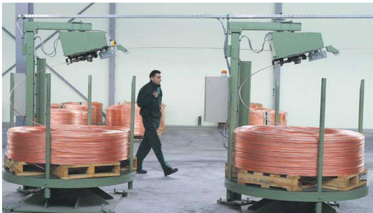
▶ Медта с гостапка след три месеца поскъпна с 2.6% и достигна 9030 USD/т на борсата в Лондон. Запасите от метала вече намаляват 12-и пореден ден

Индексът GSCI спадна с 11% през първата седмица на май, което е най-значителният му спад от декември 2008 г. Причината за това е намаляването от страна на спекулативните инвеститори на позициите им в редица стоки - от мед до петрол, заради опасения, че икономическият растеж в света се забавя. Редица държави, а и Европейската централна банка вече повишиха лихвите си.