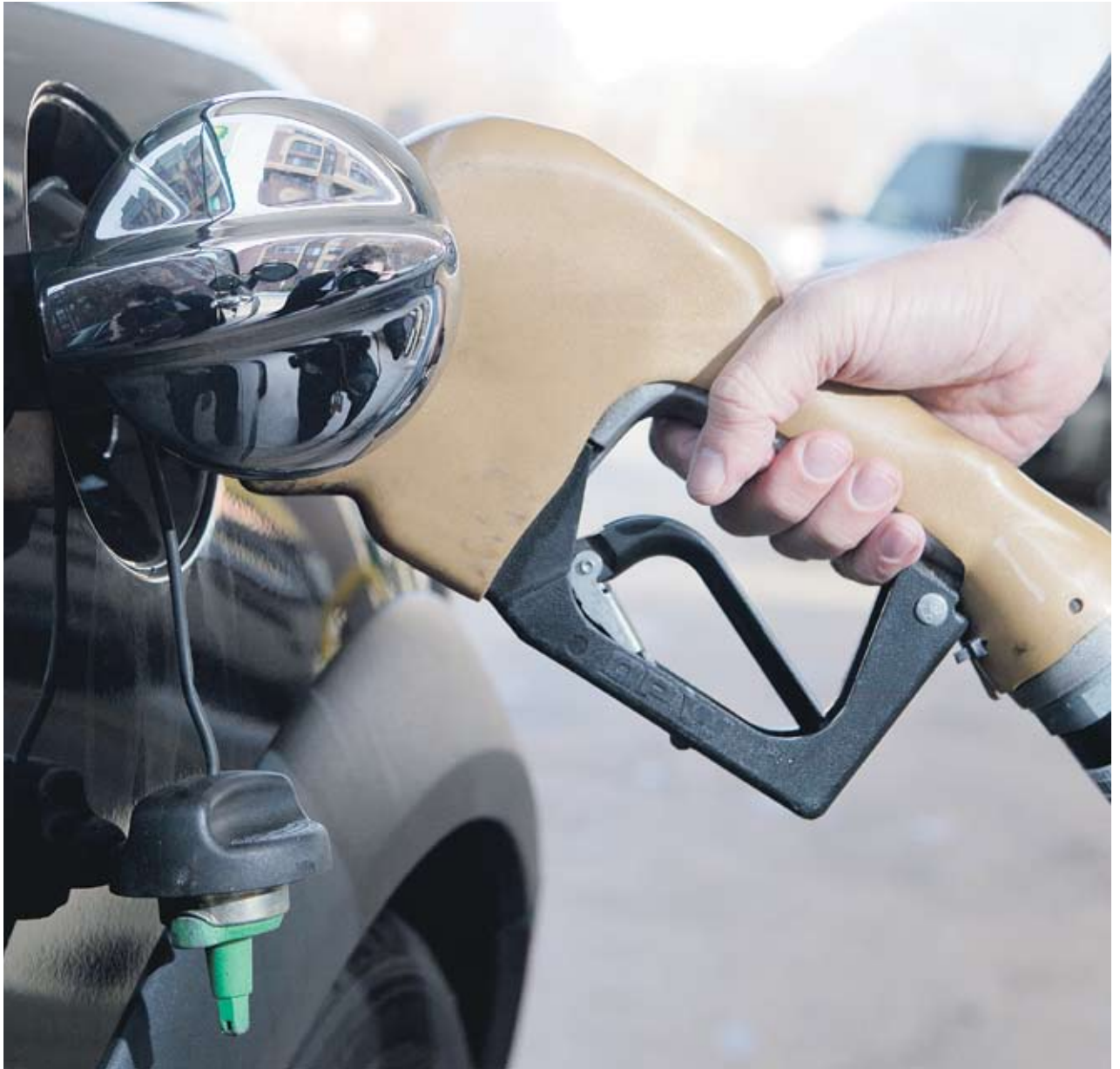
► За една година бензинът в Гърция е поскъпнал с близо 70 евроцента

На фона на мораториума на цените на бензина Гърция поиска нова разсрочка по кредита от ЕС и МВФ. Страната получи 110 млрд. EUR помощ от Евросъюза и фонда в замяна на строги фискални ограничения. Според чужди анализатори това е поредният сигнал, че положението е доста сериозно и Гърция няма да може да избегне реструктурирането на държавния дълг, който е в размер на 330 млрд. EUR. ■