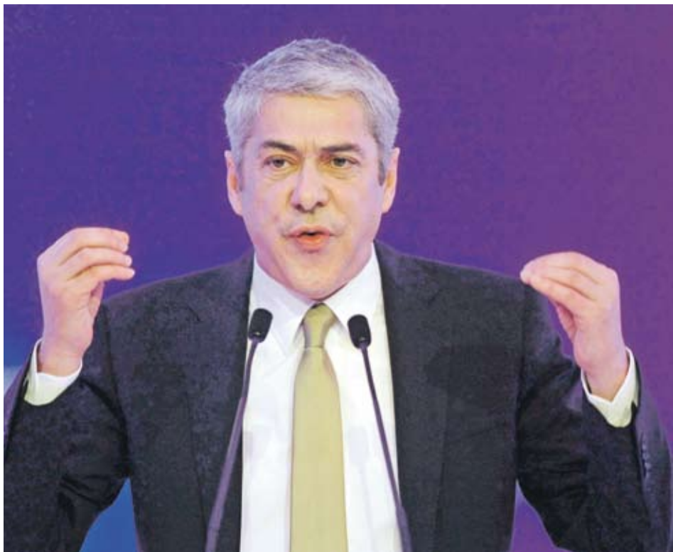
► Планът не налага нови мерки за пестене на средства през тази година, нито незабавно намаляване на по-ниските пенсии или заплатите в държавния сектор, подчерта премиерът на Португалия Жозе Сократиш