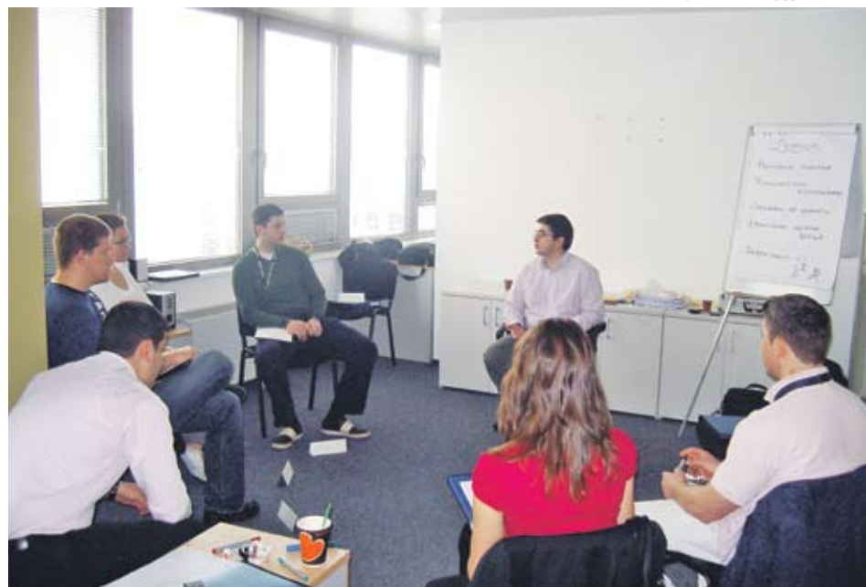
СНИМКИ АДЕССО БЪЛГАРИЯ

▶ Служителите на Адесо посещават 20 вида обучения по европроекта на компанията, като например за подобряване на презентационните им умения, управление на проекти, обучения в сферата на търговията и т.н.