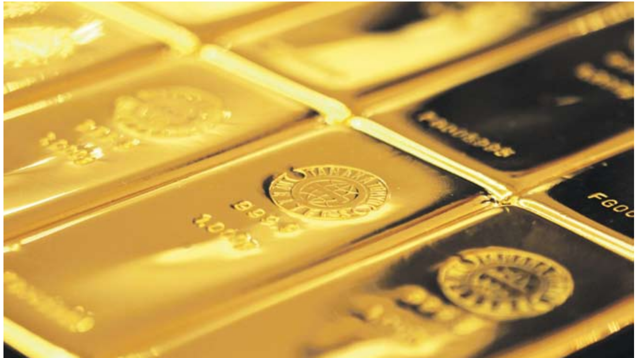
▶ Фючърсите на златото отстъпиха с 0.2% до 1537 USD за унция

Спот среброто се покачи до най-високото си ниво за всички времена от 49.79 USD за унция на 25 април, което е 12-кратно увеличение в сравнение с най-ниската му стойност от 4.04 USD, отбелязана през 2001 г. Златото пък достигна ре-