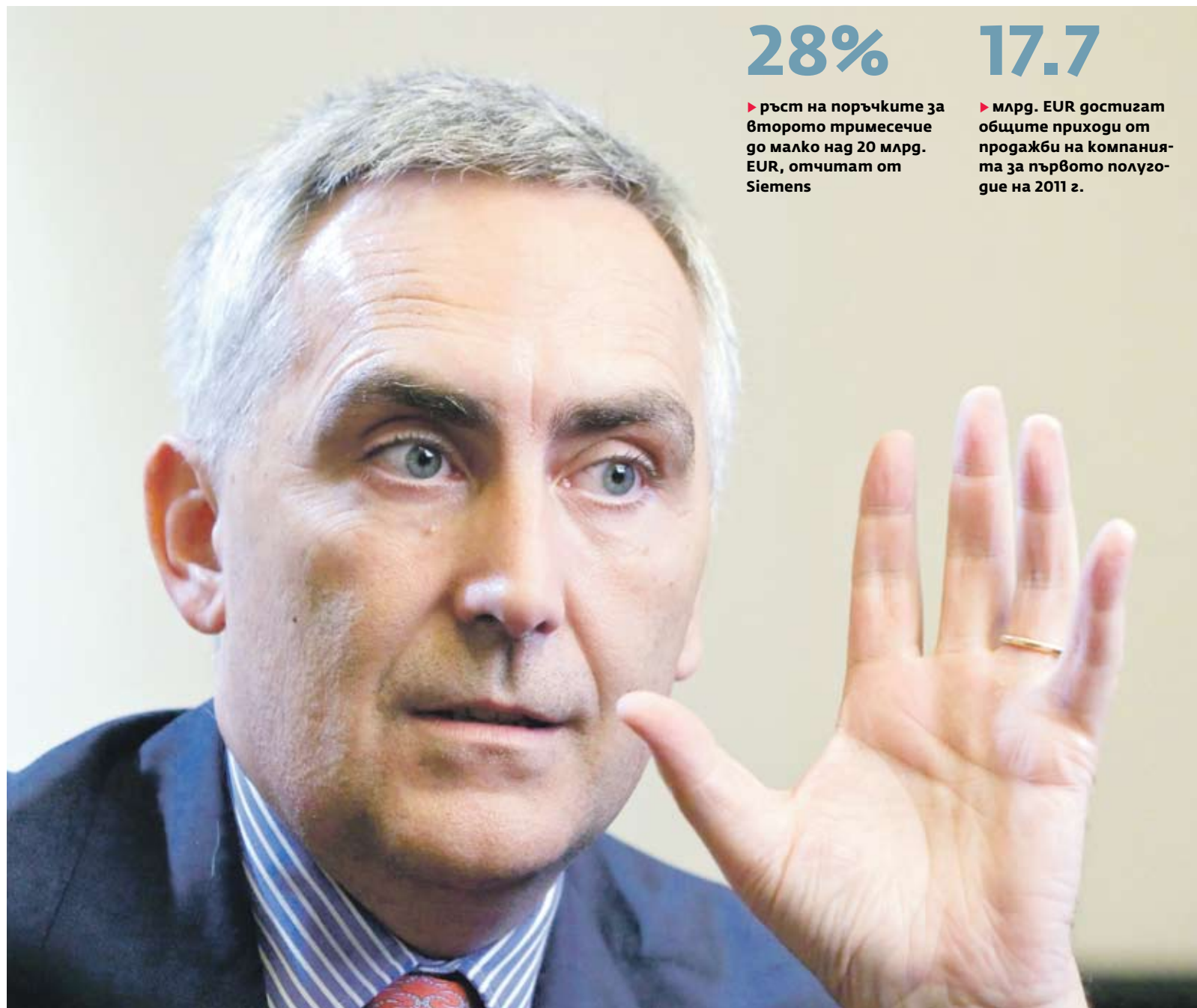
▶ Главният изпълнителен директор на Siemens Питър Льошер ускори реорганизацията на компанията с продажбата на подразделенията за поддръжка на компютри, носещо загуби четири поредни години, на френската Atos