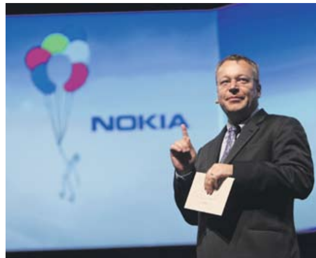
► Новият гл. изп. директор на Nokia Стивън Елоп приема реструктуриране на изоставащия бизнес със смартфони

Производителят на мобилни телефони ревизира в посока нагоре очакванията си за световното търсене. Според Nokia до края на 2010 г. ръстът ще надхвърли 10%, но за цялата година компанията прогнозира намаляване на пазарния си дял в сравнение с 2009 г. За последното тримесечие на т.г. финландците прогнозират спад на продажбите си до 8.2-8.7 млрд. EUR.