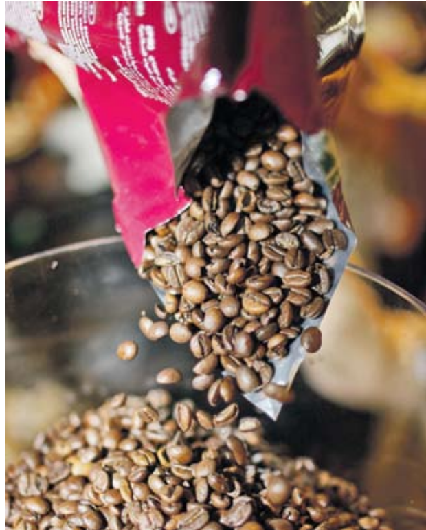
► Слабата реколта на кафе в Бразилия и Колумбия ще доведат света до дефицит от близо 80 хил. т през 2011 г.

момента техният обем е 96 хил. т. На фона на слабите добиви, които очакват света през 2011 г., идват и прогнозите за силно търсене през тази година. Според изчисленията на Masqarie Group Ltd. търсенето в световен мащаб ще надвиши с 78 хил. т предлагането през 2011 г. На борсата в Ню Йорк фючърсите на кафето сорт Арабика за декември поскъпнаха с 1.91% до 4425 USD/т. При каквото също имаше поскъпване от 1.3% до 2813 USD/т. □