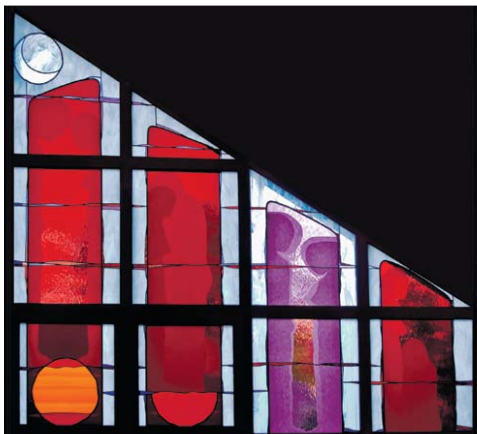
► За да се разкрие истинската красота на стъклото, е необходима светлина