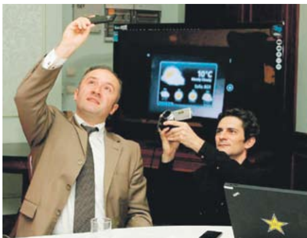
► LG Optimus 7 е първият Windows Phone 7 в България