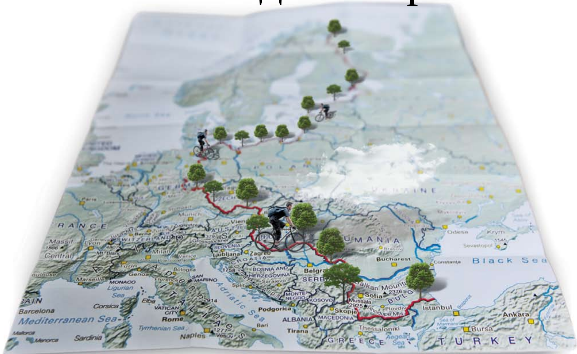
Илюстрация: Гриша Струнджев