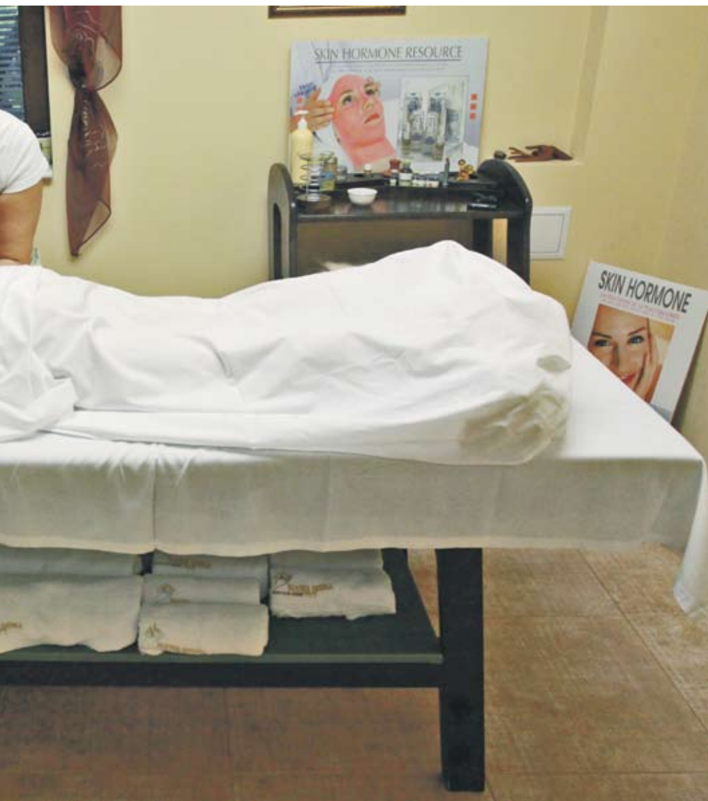
премахва натрупаното напрежение