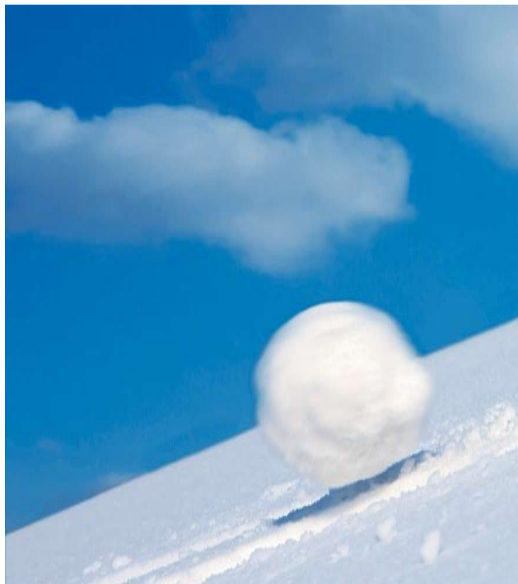
►Намерението на правителството да закрие частните професионални пенсионни лавина от негативни реакции

Пенсионните дружества, които продължават да бъдат в неведение какво ще стане със средствата, които управляват, обявиха, че са шокирани от изказвания на премиера, които са прочели в публикуваната стенограма от заседанието. Според тях Борисов е взел решение, без да познава дейността на професионалните пенсионни фондове. Вероятно подведен от синдикатите. Възможно е да не се стигне до подобна мярка, смятат