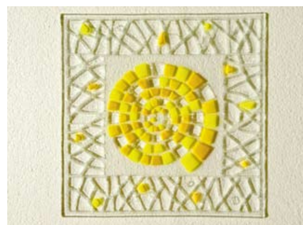
► Цветните стъклени изделия действат пряко на настроението