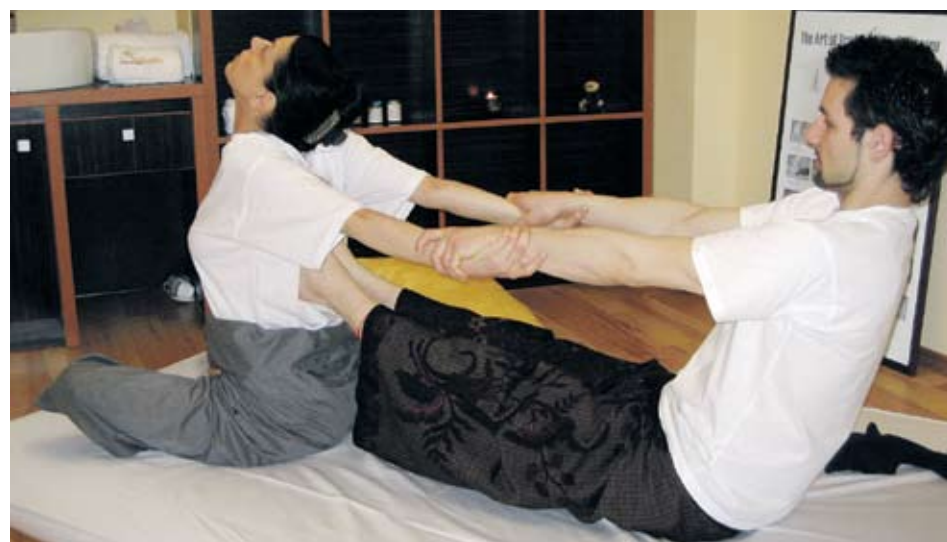
►Юмейхо терапията - това е масаж, който се прилага чрез така наречените изпуквания

Много от добре познатите продукти имат полезно и лечебно действие по време на масажи. Сред най-из- ползваните са мед, шоко- лад, специални масажни и етерични масла.