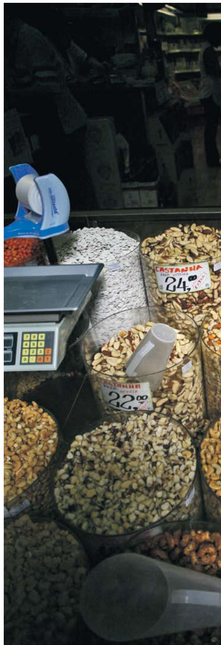
▶ Продажбите на скъпи ядки намаляват, а на евтини се увеличават