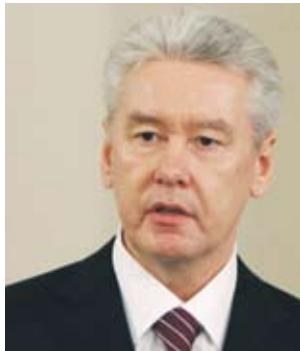
Печеливш Сергей Собянин