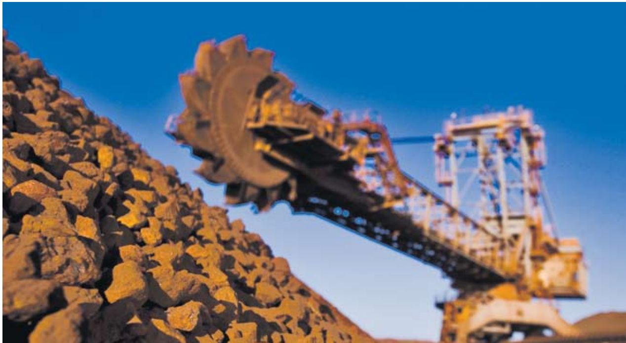
► Големите инфраструктурни проекти в страната, които ще бъдат изградени през следващото десетилетие, гарантират увеличаване на потреблението и вноса