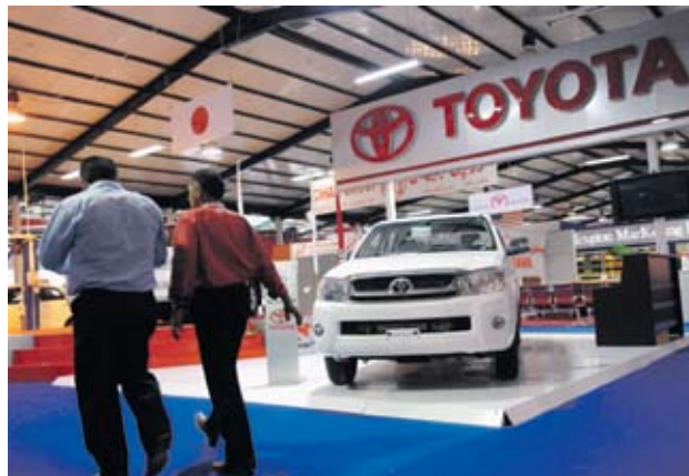
► Техническите проблеми с моделите на Toyota прогължават да рушат репутацията на марката

Съобщението идва по-малко от два месеца, след като 1.3 млн. коли от други два модела на компанията - Corolla и Matrix, трябваше да бъдат изтеглени в САЩ и Канада заради дефектни модули за контрол на двигателя, които може да причинят внезапното спиране на машината. Техническите проблеми започнаха още през миналата