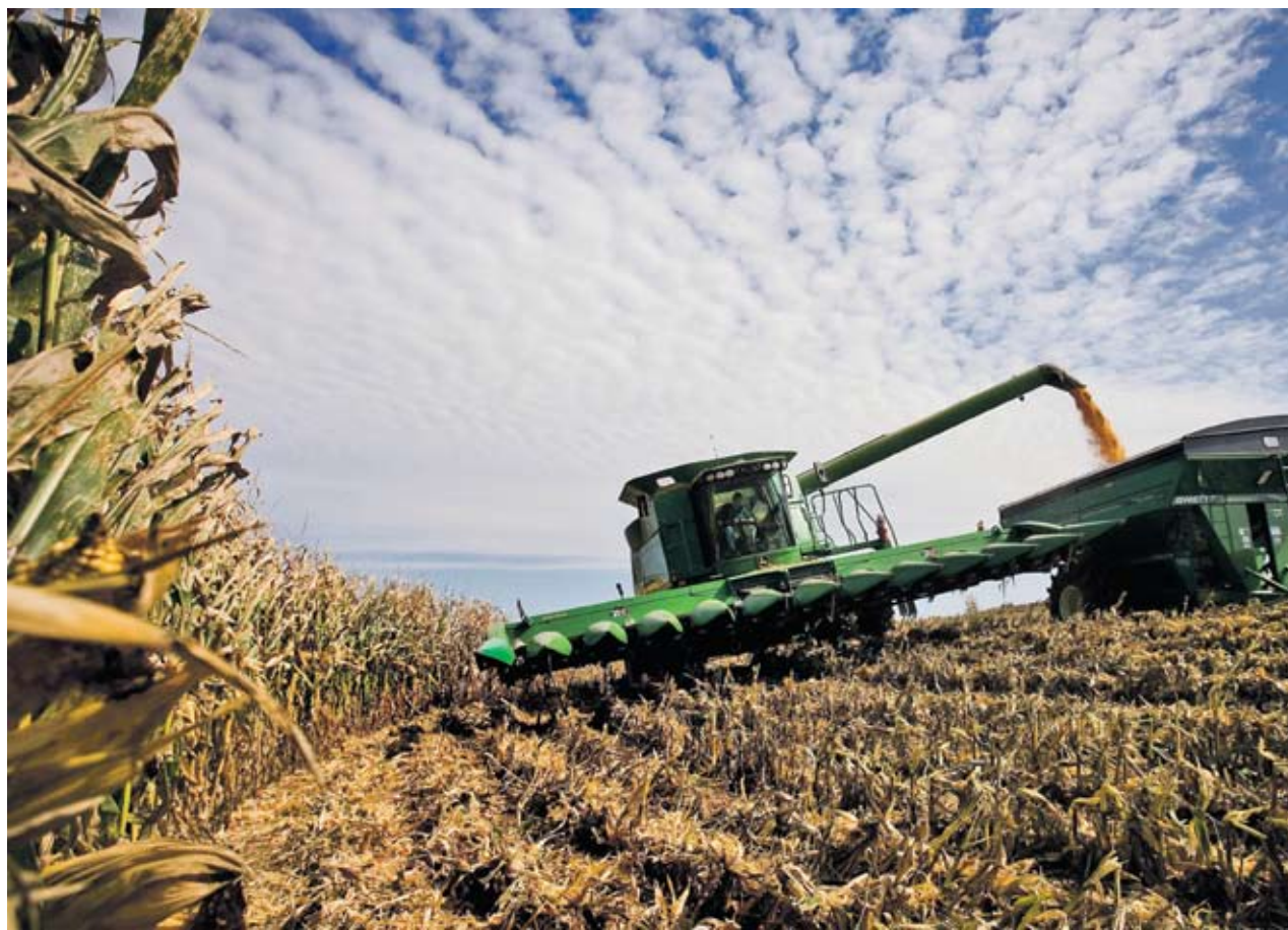
► Зърнопроизводителите твърдят, че следващата селскостопанска година се очертава да бъде лоша, защото есенната сеитба закъснява. "Това, че тази година беше добра, не е причина да ни ощетяват и да бавят плащанията", казват от НАЗ

От асоциацията твърдят, че не знаят кога Министерството на земеделието и храните (МЗХ) ще започне да изплаща европейските директни плащания. Тази година те ще бъдат по 17.20 лв. на декар. В меморандума е записано, че плащани-