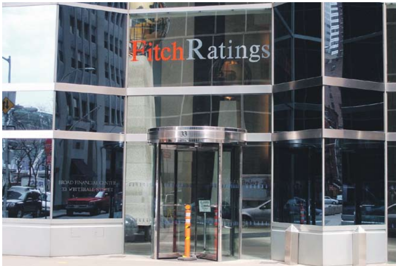
► Рейтинговата агенция Fitch е определила негативна перспектива на 15 от 44-те банки в Източна Европа. Шест от тях са в България

Лошите кредити и разчитането на чуждестранно финансиране са риск за Балканите