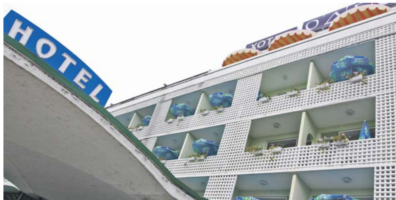
► Туристическият данък ще увеличи цените на нощувките, казват хотелиери

От столичния петзвезден хотел „Арена ди Сердика“ са платили над 10 хил. лв. туристически такси от на-