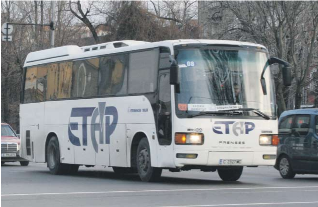
► Освен транспорт в дейностите на "Етап Адресс" близа и гобив на минерална вода под марката "Ком"

"Етап Адресс" се договори с кредиторите си в края на май да разсрочи облигационния си заем с половин година до ноември 2011 г. Част от условията бяха да са увеличили и лихвата по заема - от 7.325 на 9% на година. Кредиторите изискаха и допълнителни