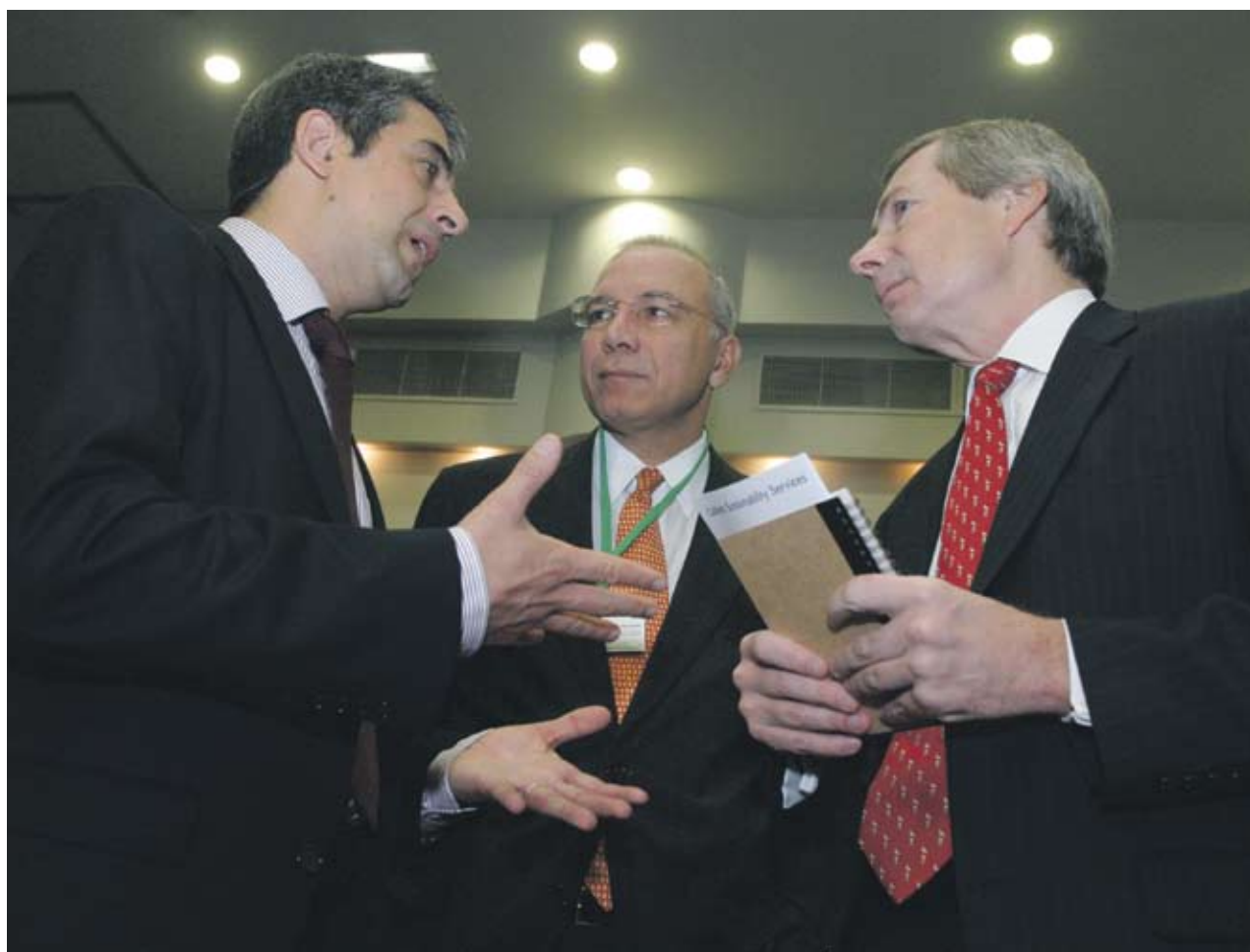
► Росен Плевнелиев (вляво) обсъжда с американския посланик у нас Джеймс Уорлик световните стандарти за "зелено" строителство

Престъпни според министъра са 57 казуса и те са предадени от МРРБ на прокуратурата. Последният от тях е за единната информационна система на ведомството. "Това е тотално безобразие. За това, че някой е написал