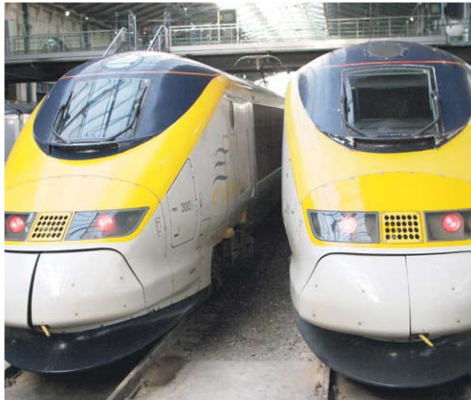
► В момента единствено влаковете на Eurostar отговарят на изискванията да пътуват под Ламанша

Решението на Eurostar да поръча влаковете от Siemens е сериозен удар срещу френската Alstom, която е производител на сегашното оборудване на компанията. От Eurostar обаче обясниха, че изпълнителят е бил избран с открит конкурс и не е имало лобистки натиск. Френската държавна компания Societe Nationale des Chemins de fer Francaise е мажоритарен собственик на Eurostar с 55% от капитала.