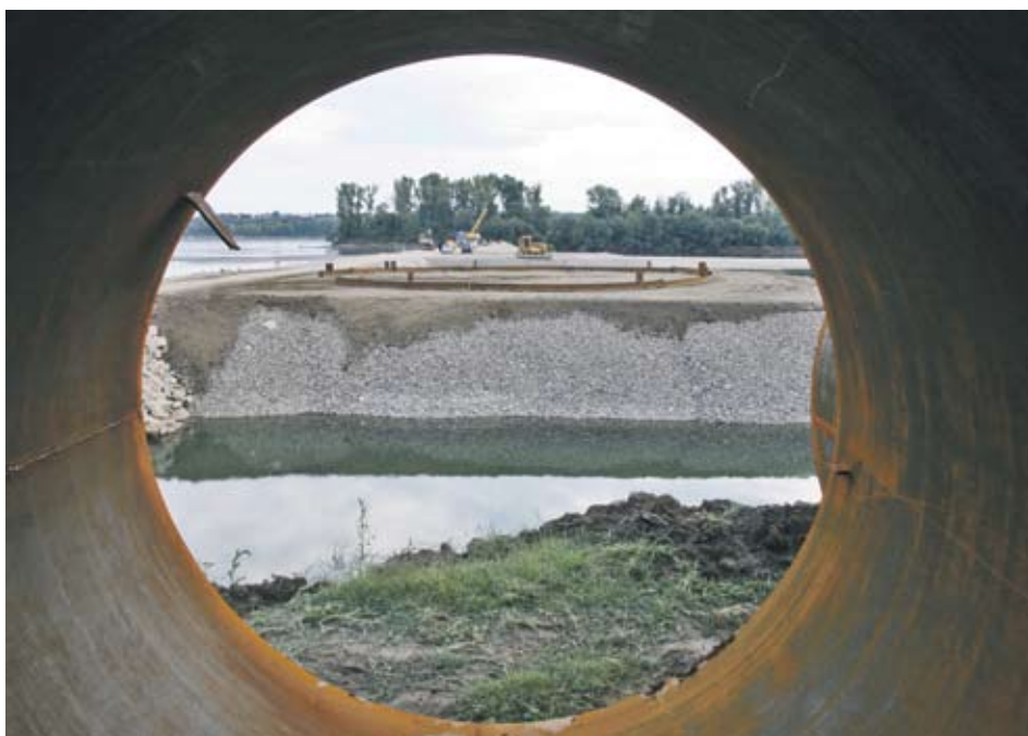
► Срокът за изграждане на Дунав мост 2 може да бъде отложен с още шест месеца

"Поредното отлагане на пусковия срок на Дунав мост 2 ще доведе до сериозни загуби на двете държави", каза министър Цветков. Според Анка Боаджу само преди три месеца FCC са обещали да завършат моста до края на 2011 г., а сега искат необосновано отлагане. По думите й загубите за Румъния от закъснението