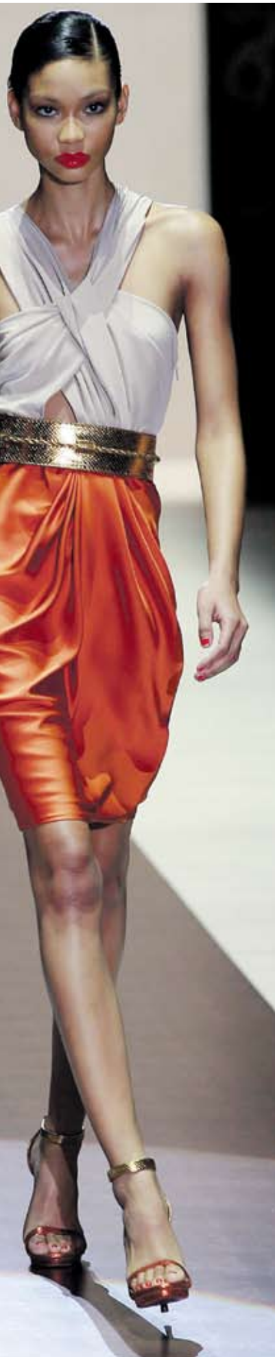
жената, която обича