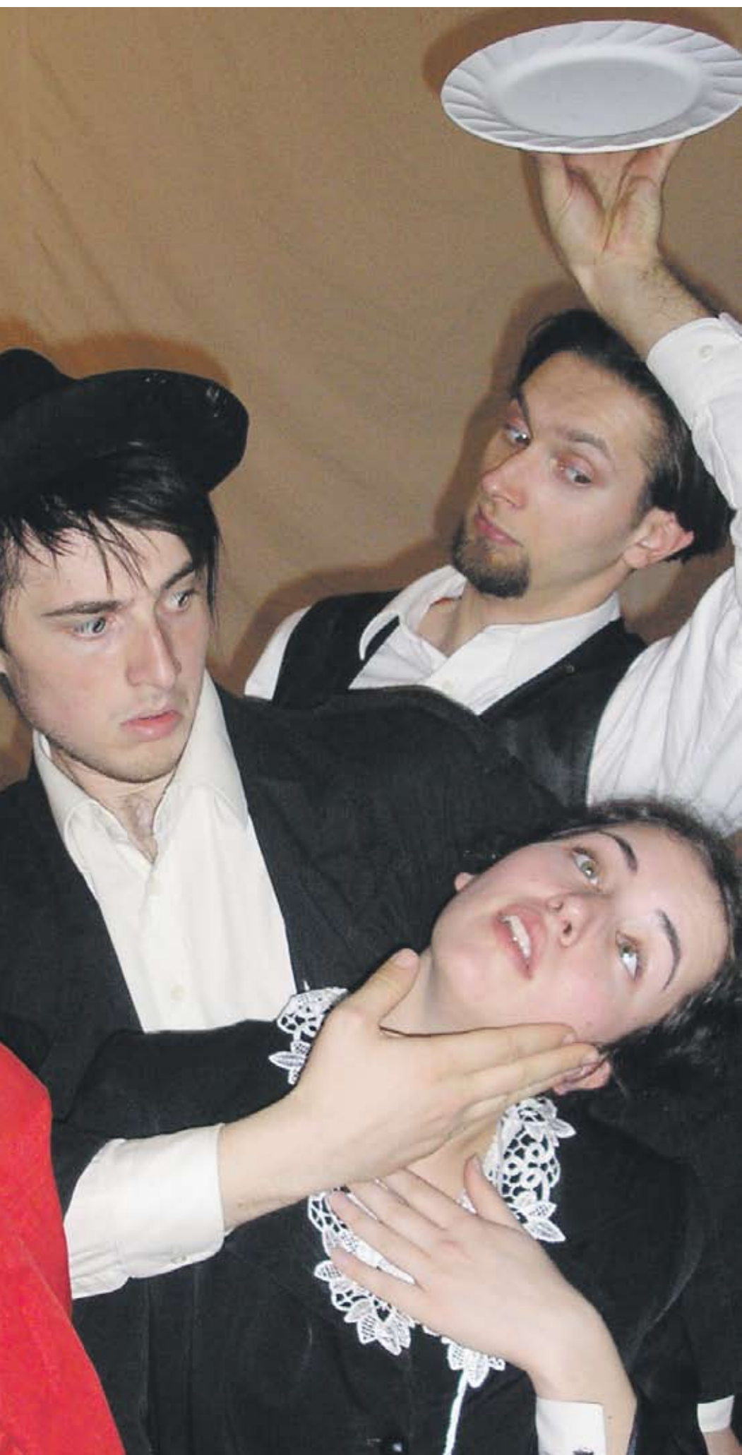
Любители, са от различни професии - от PR, журналисти и банкови служители