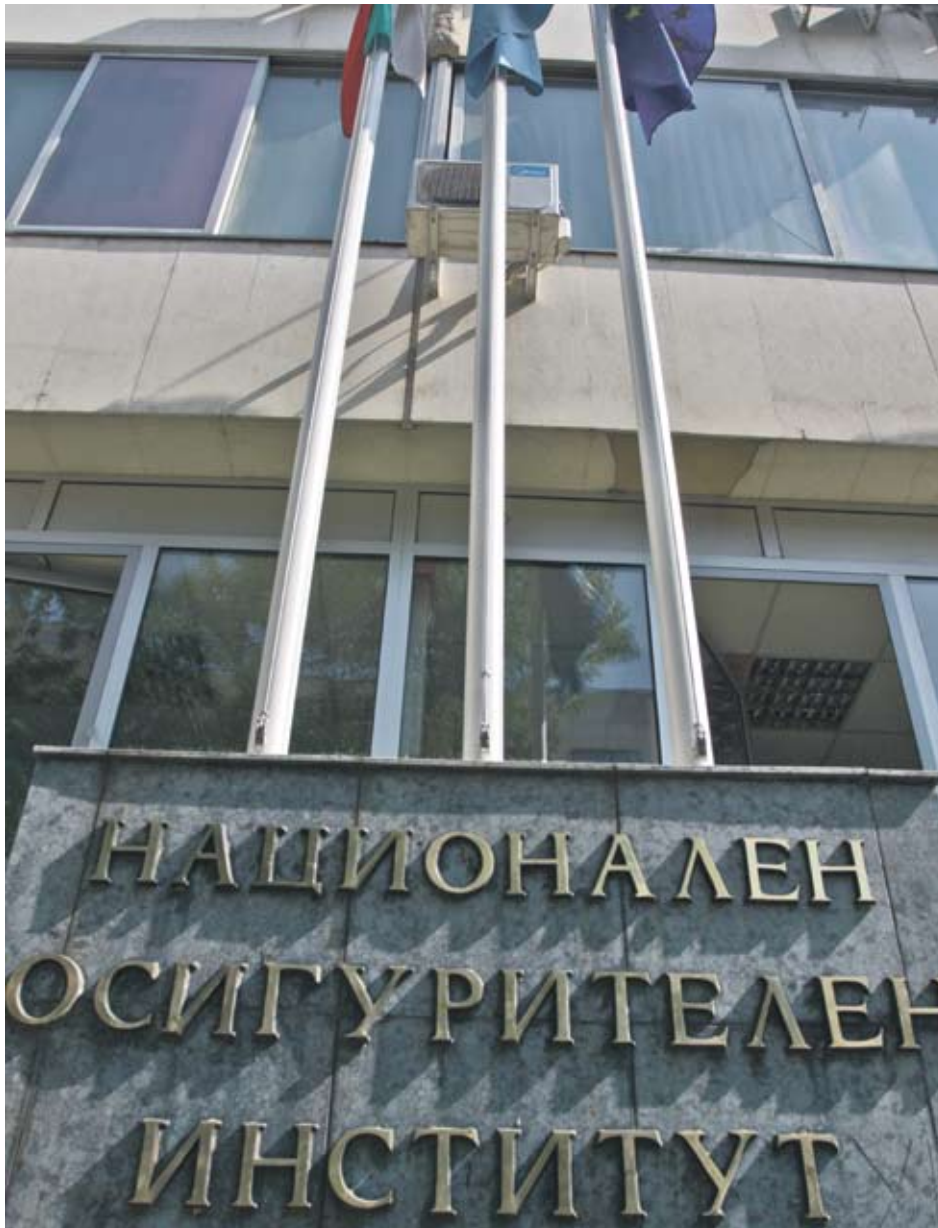
▶ Няма да постъпят повече пари в НОИ, както прегвизжда правителството, твърдят повечето финансисти