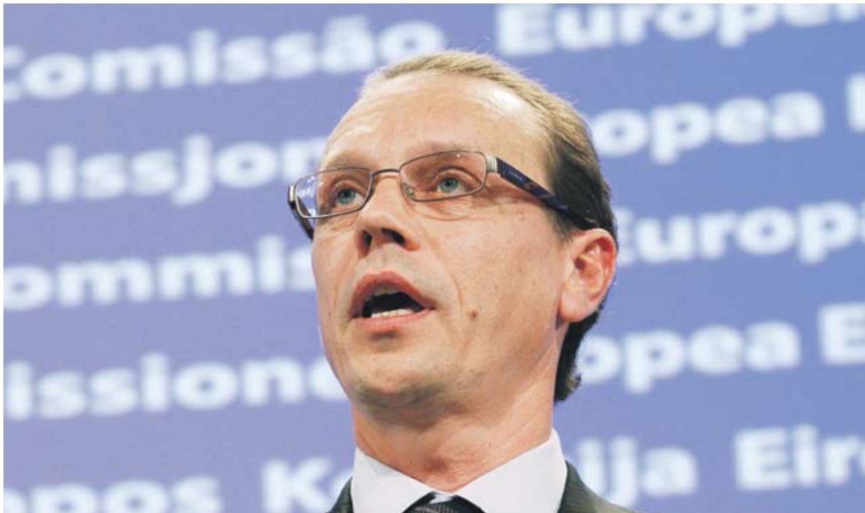
► Данъкът върху финансовите дейности не само ще стабилизира сектора, но ще направи облагането на банките по-честно, смята еврокомисарят по данъчната политика Алгирдас Шемета

ЕК подкрепи и предложението на Франция и Германия за въвеждане на данък върху финансовите трансакции като търговията с акции и облигации. Такъв данък обаче, ако бъде одобрен, трябва да бъде въведен в целия свят. В противен случай това ще накара банките да изместят бизнеса си на друго място, смята еврокомисарят по данъчната политика Алгирдас Шемета. За подобна опасност миналата седмица