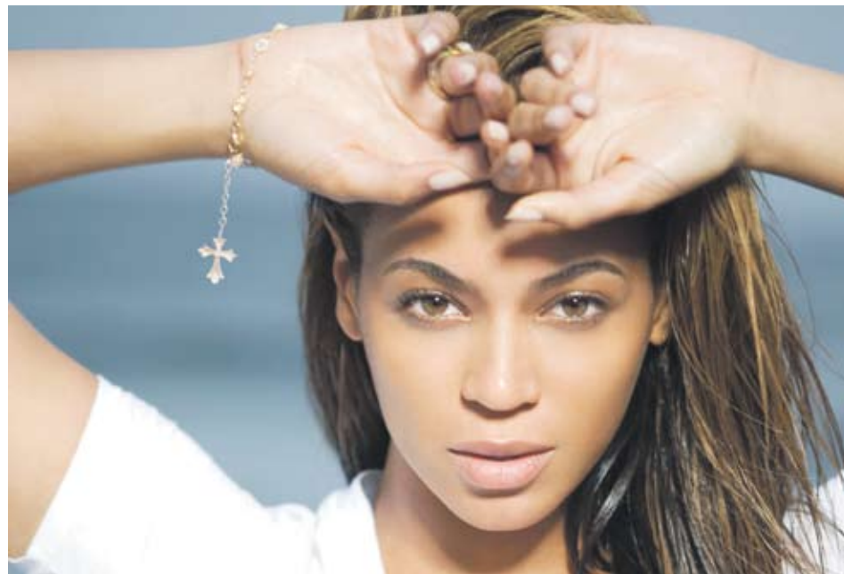
► Освен музикалните успехи кариерата на Бионсе Ноулс включва 7 филма, множество рекламни участия и собствена линия парфюми