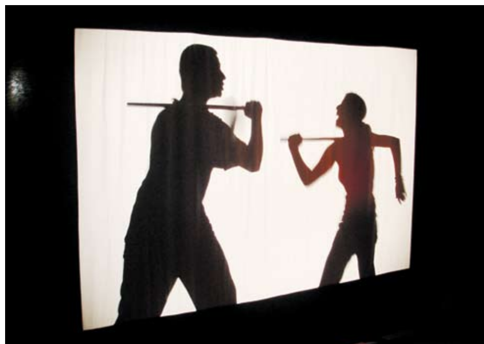
► При театъра на сенките се разказват всякакви приказки - страшни, смешни, философски или фантастични