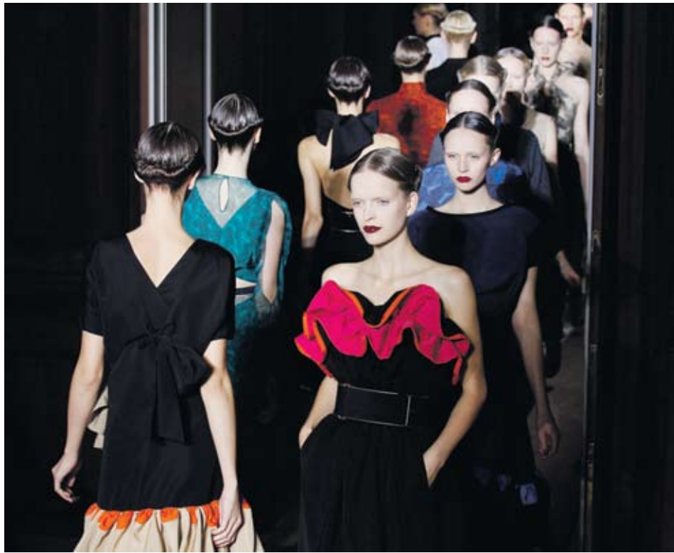
►Рокли, разкриващи повече плът, предложи марката „Ив Сен Лоран“ на модния подиум в Париж

Inditex, която е най-големият търговец на облекло в света, излага нови модели в своите магазини два пъти седмично. H&M пък продава сака