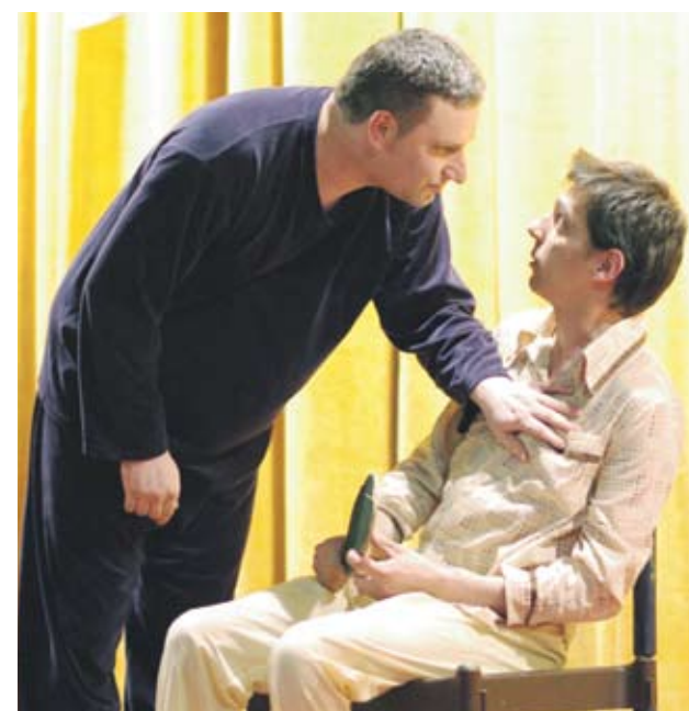
► Театърът е екипно изкуство, което учи как да разчиташ на другия