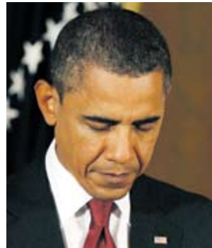
Губещ Барак Обама