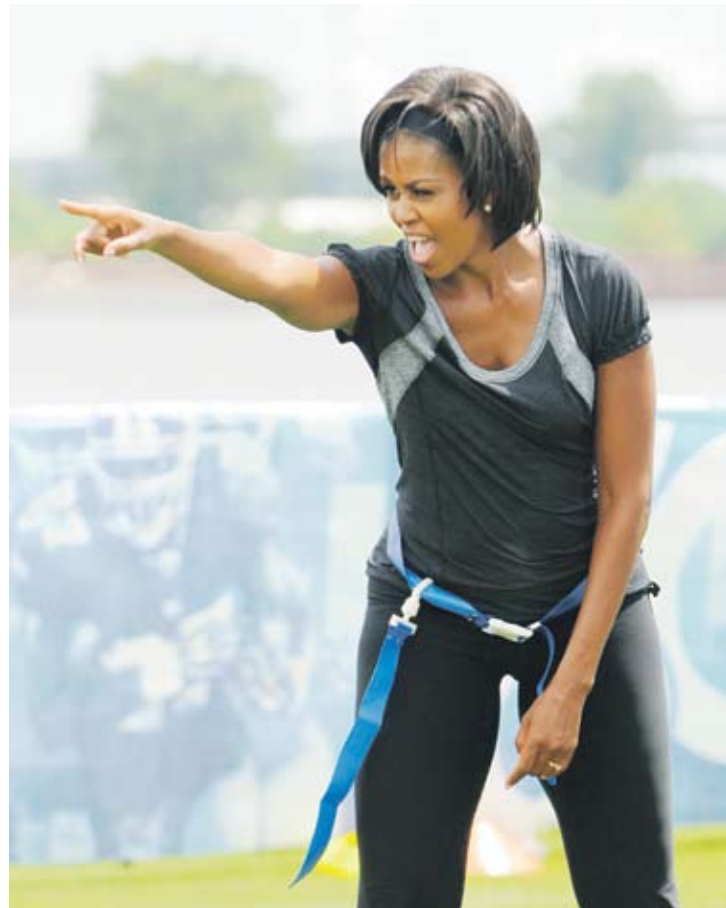
► Мишел Обама