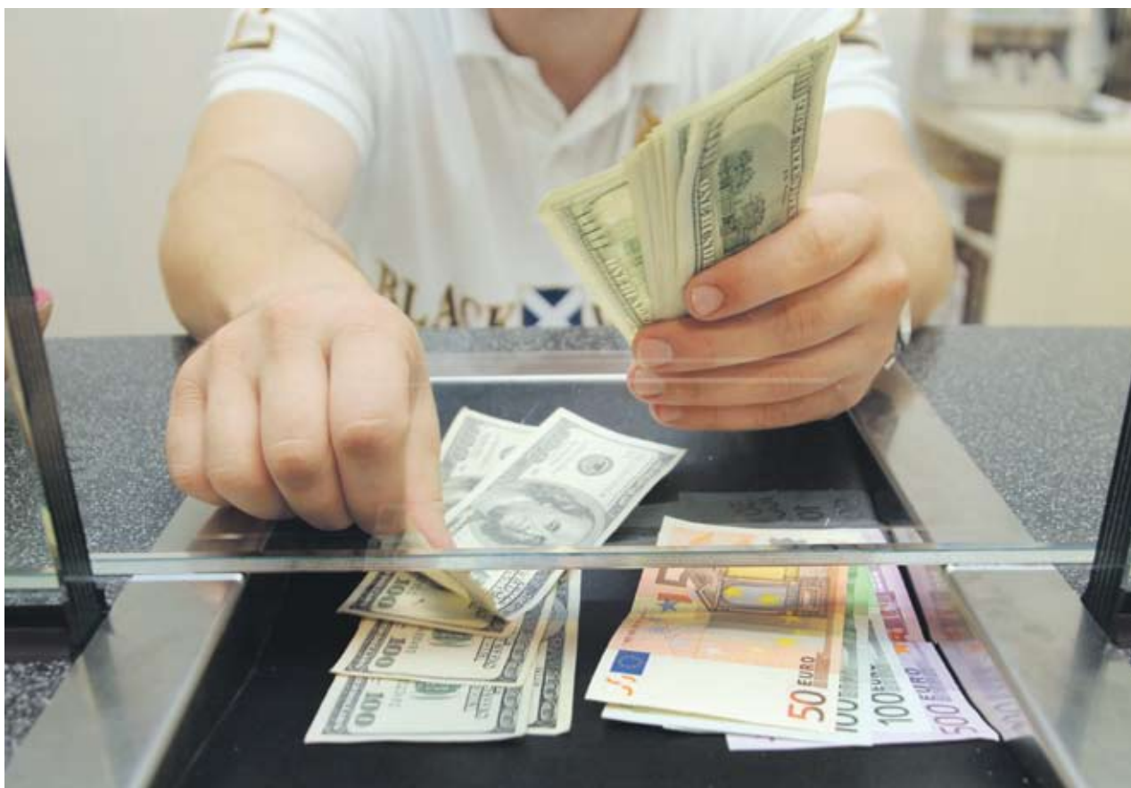
► Решението на Федералния резерв на САЩ да налее още 1 трлн. USD в икономиката прогължава да обезценява долара