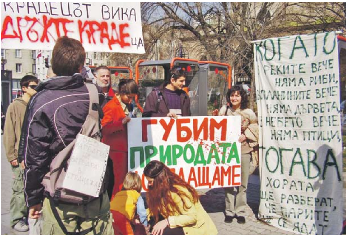
► Безобразното строителство изкара много млади хора на улицата. Ще го спре ли новият закон за горите?

” Остава и въпросът защо министърът лично е гласувал на заседанието на Министерския съвет проектозакона, който малко по-късно вече не харесва изцяло