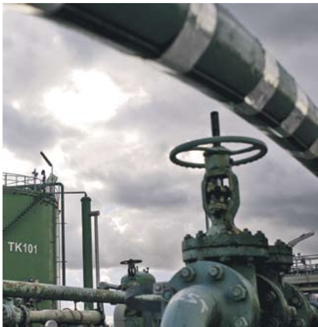
► Според финансов министър на Русия в момента цената на петрола е нереално висока

През следващите три години петролът, добиван в Русия, може да поевтинее до 60 USD/б. Това прогнозира руският финансов министър Алексей Кудрин. По думите му не е изключено тази ниска цена да се задържи около половин година.