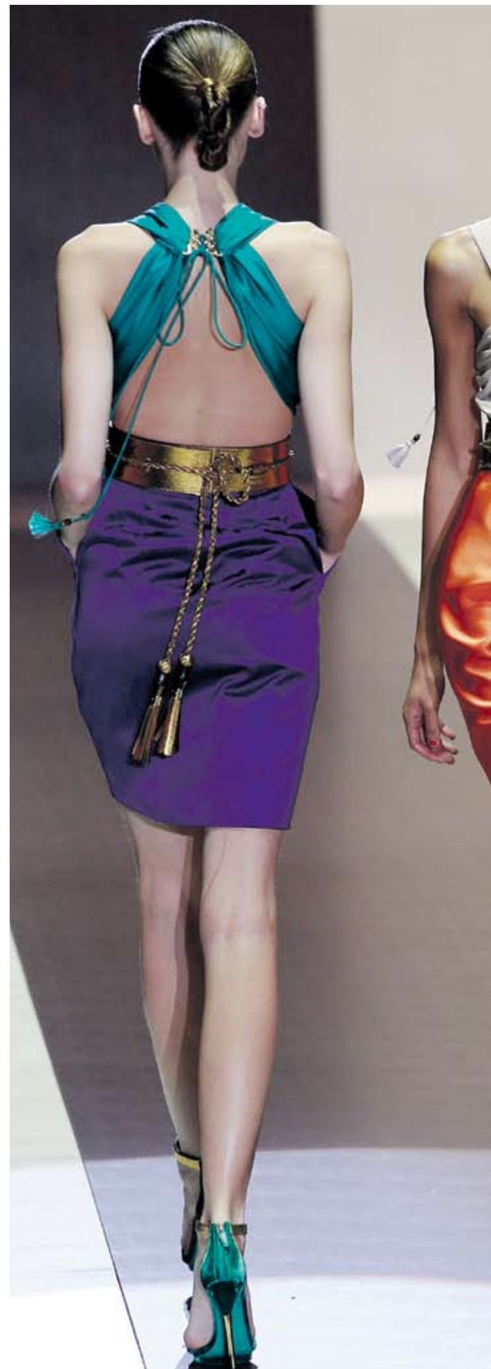
►Колекцията на „Гучи“ показва как трябва да изглежда лукса

В отговор на очакванията на лоялните клиенти компании като Cavalli, Chanel и Yves Saint Laurent започнаха да