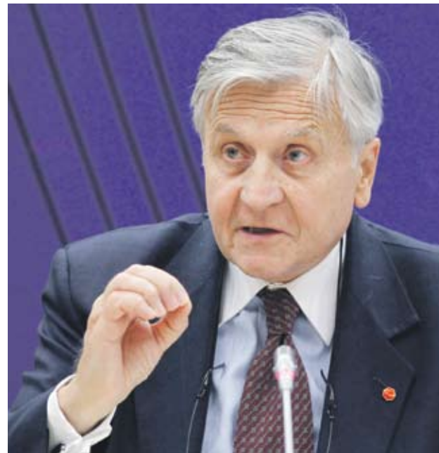
► Президентът на ЕЦБ Жан-Клод Трише заяви, че подкрепя да подкрепя "силния" долар

Трише заяви още, че подкрепя "силния долар". Въпросът за валутните курсове и международната търговия ще бъдат във фокуса на обсъжданията на срещата на Г-7 във Вашингтон, където президентът на ЕЦБ ще присъства. Наскоро финансовият министър на Бразилия Гидо Мантега заяви, че вече се вихри световна "валутна война". За същата опасност миналия ден предупреди и шефът на Международния валутен фонд Доминик Строс-Кан.