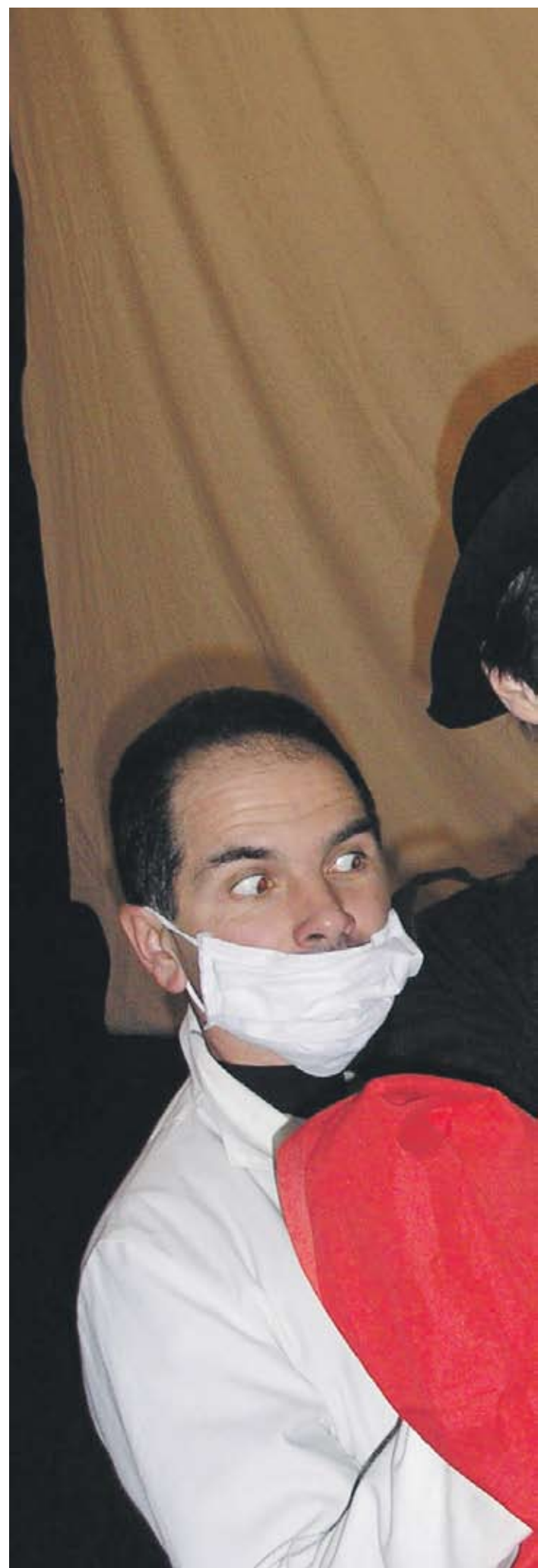
► Хората, посещаващи театралните школи за го архитекти и икономисти