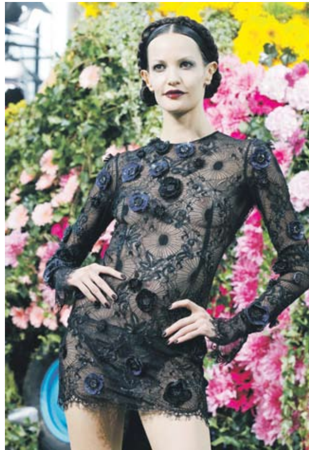
►Едно от най-чаканите ревюта в Париж - "Емануел Унгаро". Младият дизайнер на марката Джайлс Дийкън е избрал дантела, за да създаде облеклото, напомнящо онова, с което се прочу модната марка

Производителят на бутиковите чанти, шалове, обувки, кожени изделия, очила, ча-