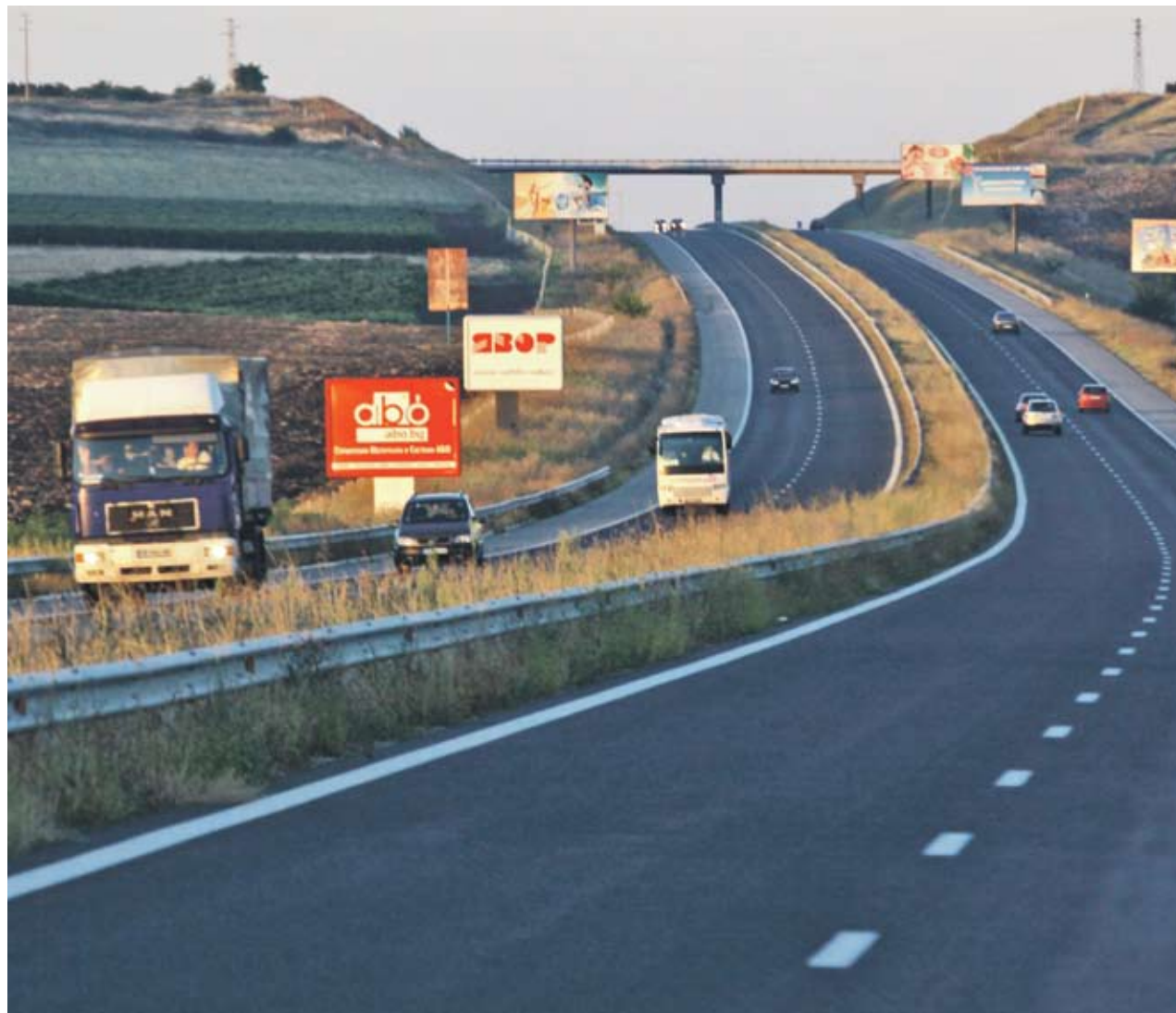
► Проблемите на “Мостстрой”, което е част от консорциума по изграждане на Лот 4 от магистрала “Тракия”, няма да попречат на изграждането на отсечката, твърди строителният министър Росен Плевнелиев

“Дружествата с подобна задлъжнялост, но с правилно мениджмънт, няма да изпитат затруднения, стига да не влияят и други фактори”, твърди Иво Толев от “Ултура Капитал Мениджмънт”. Според него в случая с “Мостстрой” има и други условия, които са довели до поисканата несъстоятелност. “В България има много висока междуфирмена задлъжня-