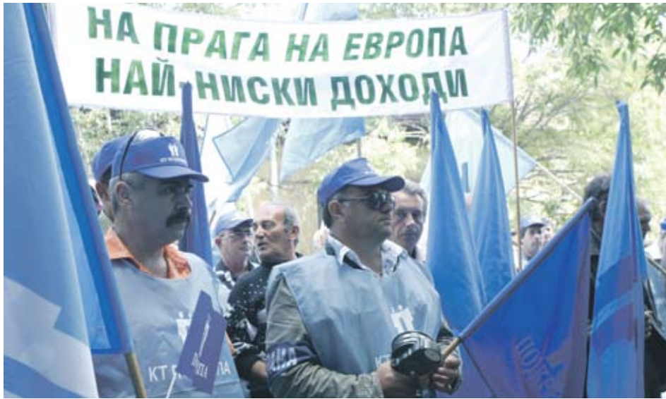
► Синдикатите заплашиха с протести наесен, защото не приемат варианта на правителството за пенсионна реформа

Новината, че правителството ще вдига от средата на 2011 г. необходимия за пенсиониране стаж от 34 на 37 години за жените и от 37 на 40 години за мъжете, вече води до ръст на молбите за пенсиониране в НОИ. Тази тенденция се подсилва и от промените в Кодекса на труда, с които се налага всички стари отпуски да бъдат изчистени до края на 2011 г. Хората с натрупани много почивни дни, които са навършили пенсионна възраст, но още работят, не искат да излизат в отпуск, а да получат парични обезщетения. Затова, въпреки че имат възможност да останат още на работа, те предпочитат да се пенсионират, преди промените в КСО да влязат в сила. Бумът от нови пенсионери заради реформата в осигуряването рискува да изправи пред допълнителни проблеми бюджета на НОИ, смятат от БСК. В същото време друга работодателска организация - БТПП, предложи