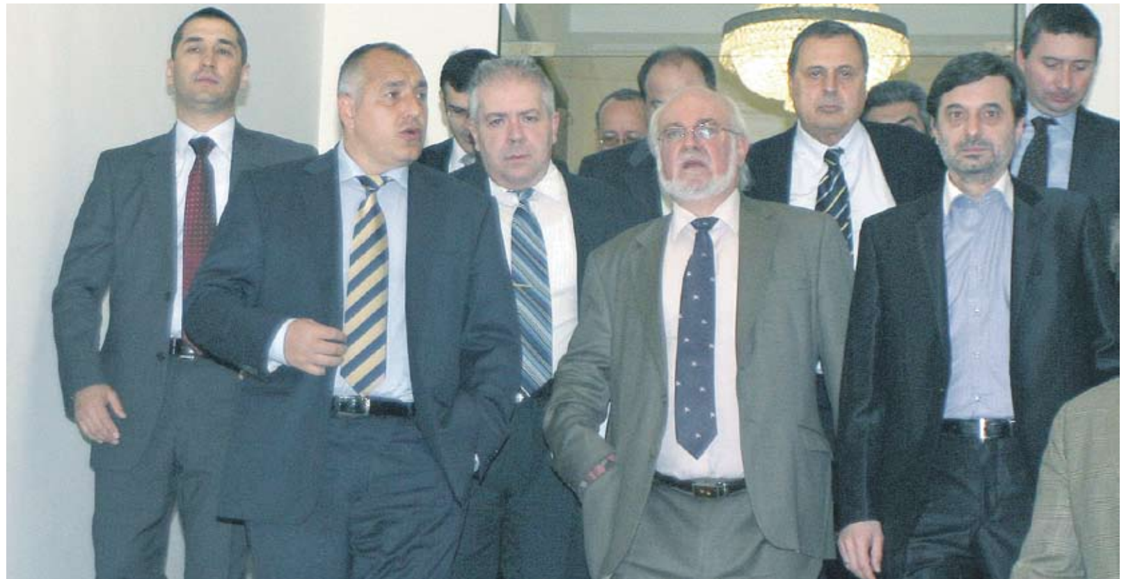
► Дори и при пълен консенсус в тристранката няма гаранции, че една или двете мярки ще бъде изпълнена така, както е договорено, или дори че изобщо ще бъде изпълнена