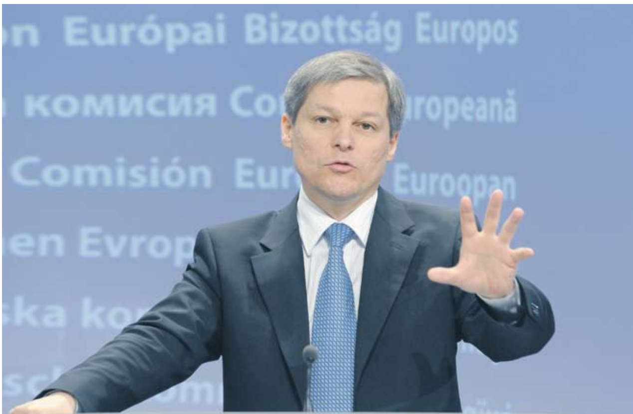
► Еврокомисарят по земеделие Дачиан Чиолош иска яснота за развитието на сектора след 2013 г.

допълнителни стимули. Според представители на Европейския парламент директните плащания на фермерите за следващия фискален период (след 2013 г.) трябва да продължат и да бъдат осигурени от бюджета на Европейския съюз. Ако бъдат съфинансирани от правителствата на отделни страни, може да се наруши честната конкуренция в единния европейски пазар.