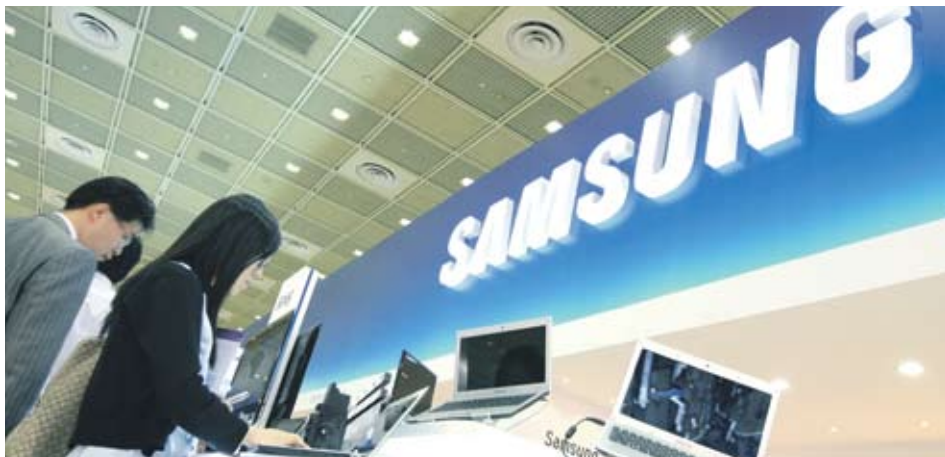
▶ Samsung ще увеличава пазарното си присъствие у нас с нови продукти като лаптопи

Компанията ще разпространява сама продуктите си в България, очаква около 250 млн. EUR оборот за 2010 г.