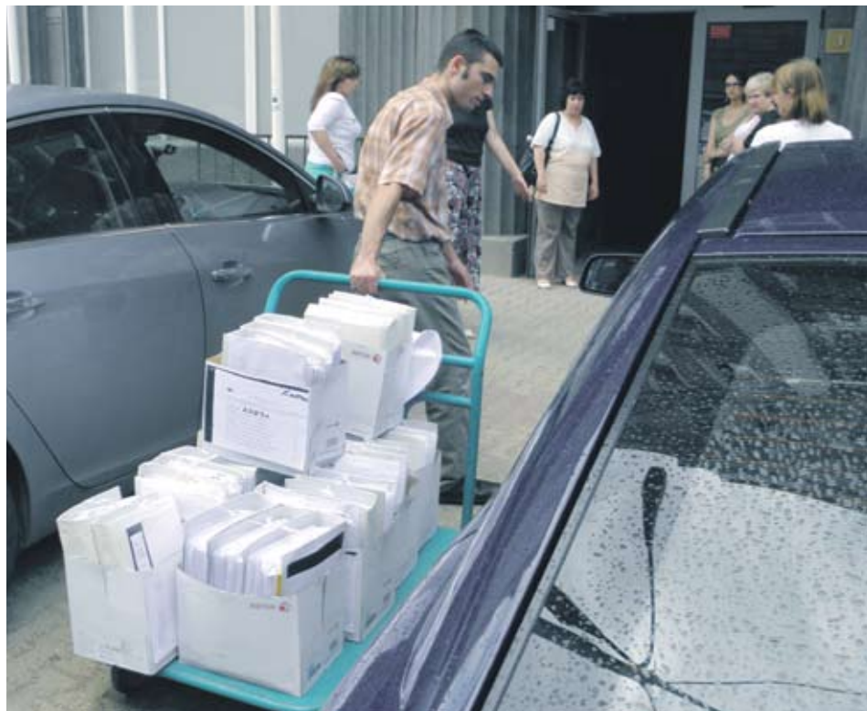
► Служител на Агенцията по заетостта тегли междинния отчет на БТПП по европроекта на палатата