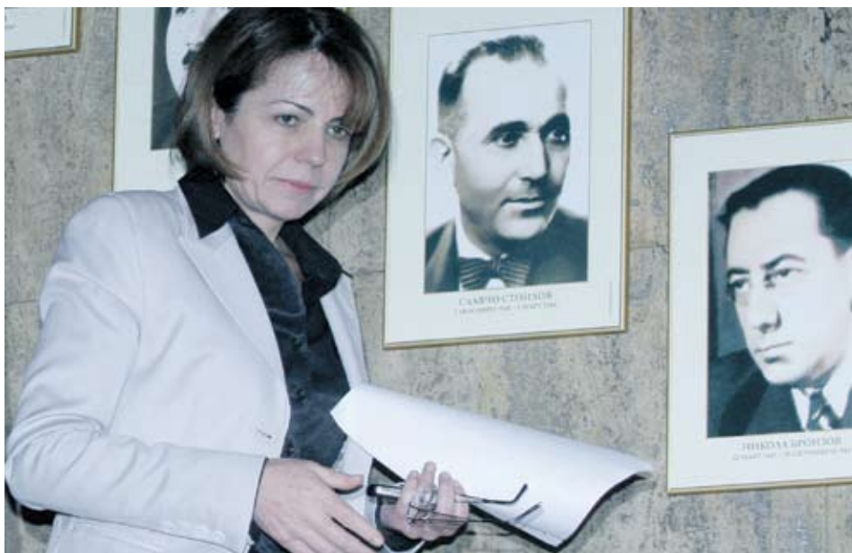
▶ Актът за публично вземане към "Метро Кеш енд Кери България" ЕООД е издаден от кмета Йорданка Фандъкова през януари 2010 г.