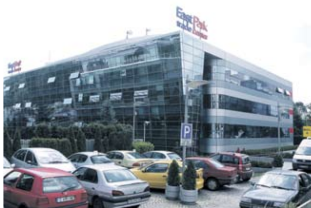
► В East park trade center om 5100 кв. м отдаваме площ свободна са едва 370 кв. м

Свободните площи са на санитарния минимум