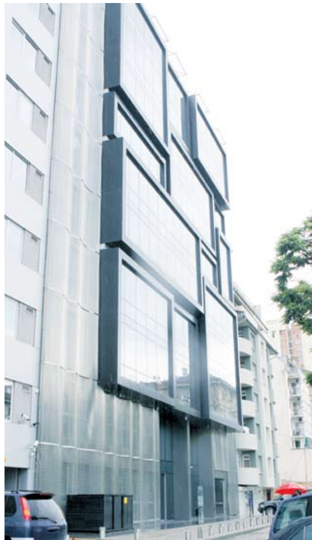
► "Кристал Бизнес център" е една от най-новите офисни сгради на бул. "Т. Александров"