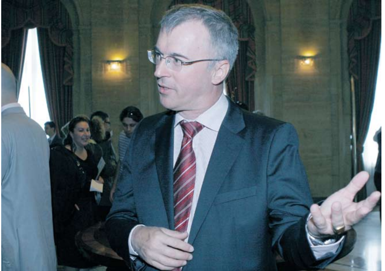
▶ Флориан Фихтъл, постоянен представител на Световната банка за България

На събитието ще присъстват изпълнителни директори и висши банкови мениджъри, както и известни представители на бизнеса и политическите среди.