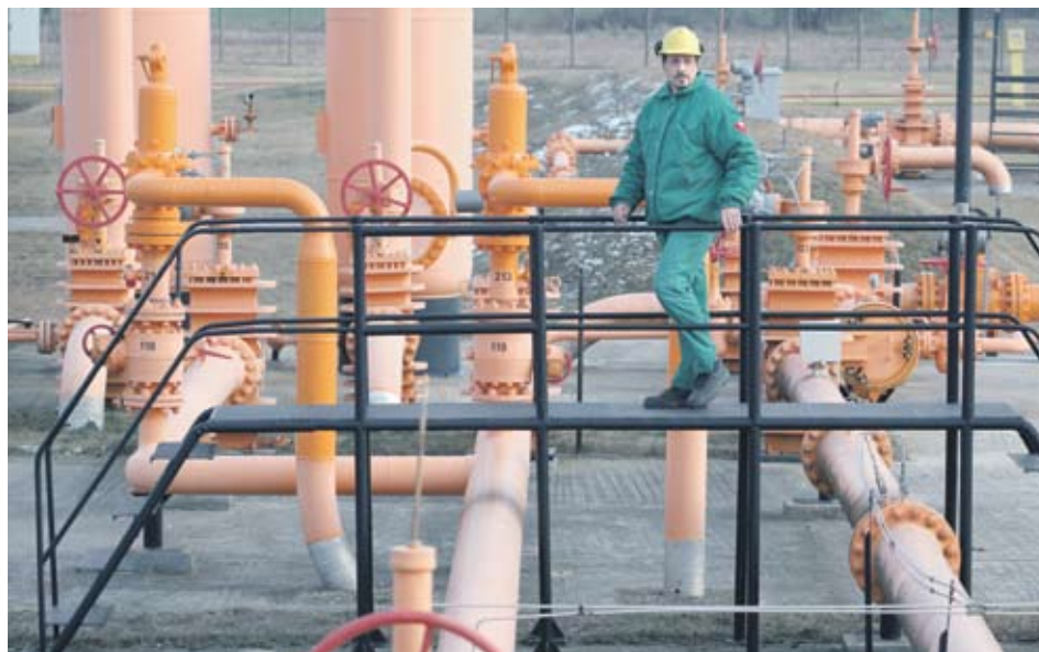
► Газопроводът „Южен поток“ може да подмине България на път за Европа