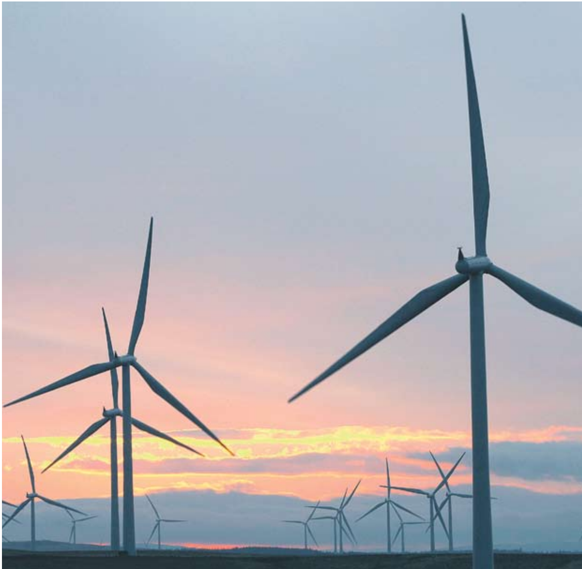
► Държавата май прави законодателни промени само по посока на вятъра. А понякога той духа и срещу собствената ѝ къщичка

Държавата вече се е видяла в чудо какво да прави с ВЕИ-тата. Затова мисли и не домисля, прави и допраща различни законодателни промени. Първо, ВЕИ-тата бяха много и се заговори за мораториум. После те започнаха да пречат на земеделието и се въведоха ограничения за изграждането им на плодородна земеделска земя. Впоследствие обаче интересите на инвеститорите и лобитата им надделяха и се оказа, че това няма да е пречка за вече започнатите ВЕИ планове. Предприемачите дори ще имат известно време гратисен период, за да дадат старт на ВЕИ проекти на места, където