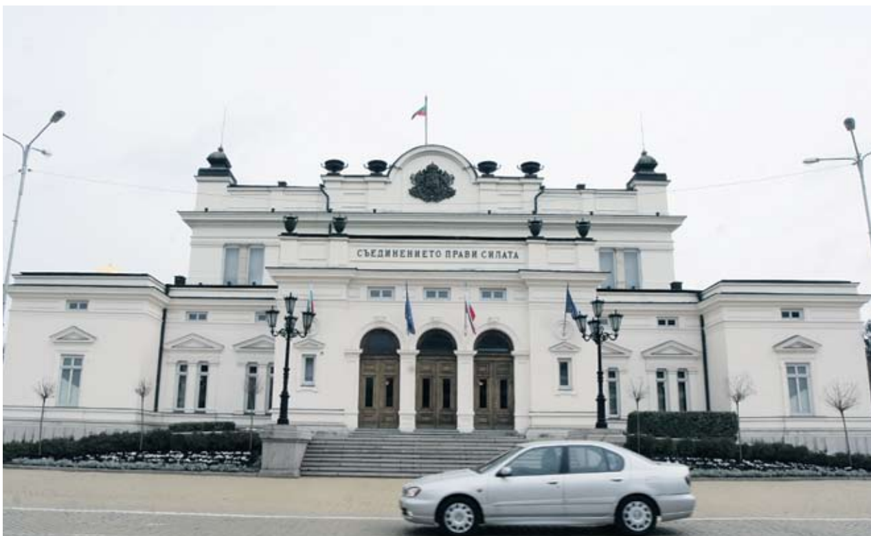
► Заложените в бюджета 1.149 млрд. лв. за структурни реформи и допълнителни фискални мерки може да се харчат без одобрението на парламента

Ревизираните бюджетни перспективи са причината за тревогата на Европейската комисия относно качеството на българската статистика, съобщи говорителят на еврокомисаря за икономическите и валутните въпроси Оли Рен Амадеу Алтафаж. ЕК съвсем наскоро е била информирана за значителни ревизии на бюджетните перспективи, което по думите му е нарушение на ангажиментите по европейските договори. Освен това комисията няма информация защо България