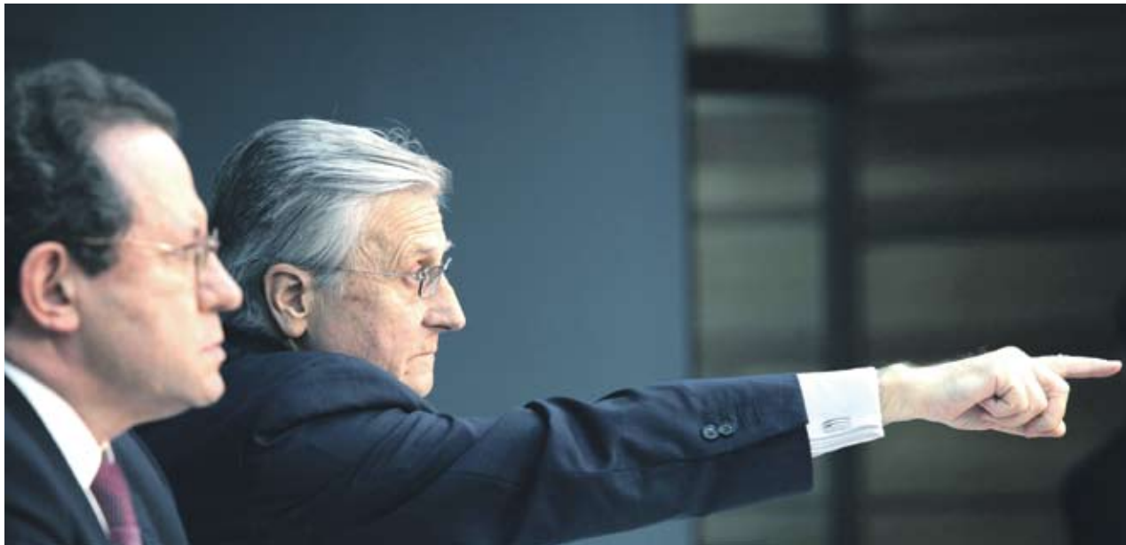
► Според председателя на ЕЦБ Жан-Клод Трише сърцевината на икономическия европейски съюз е надзор на фискалната политика на всяка страна

Европейската финансова институция е за създаване на независима агенция за контрол на бюджета на всяка страна