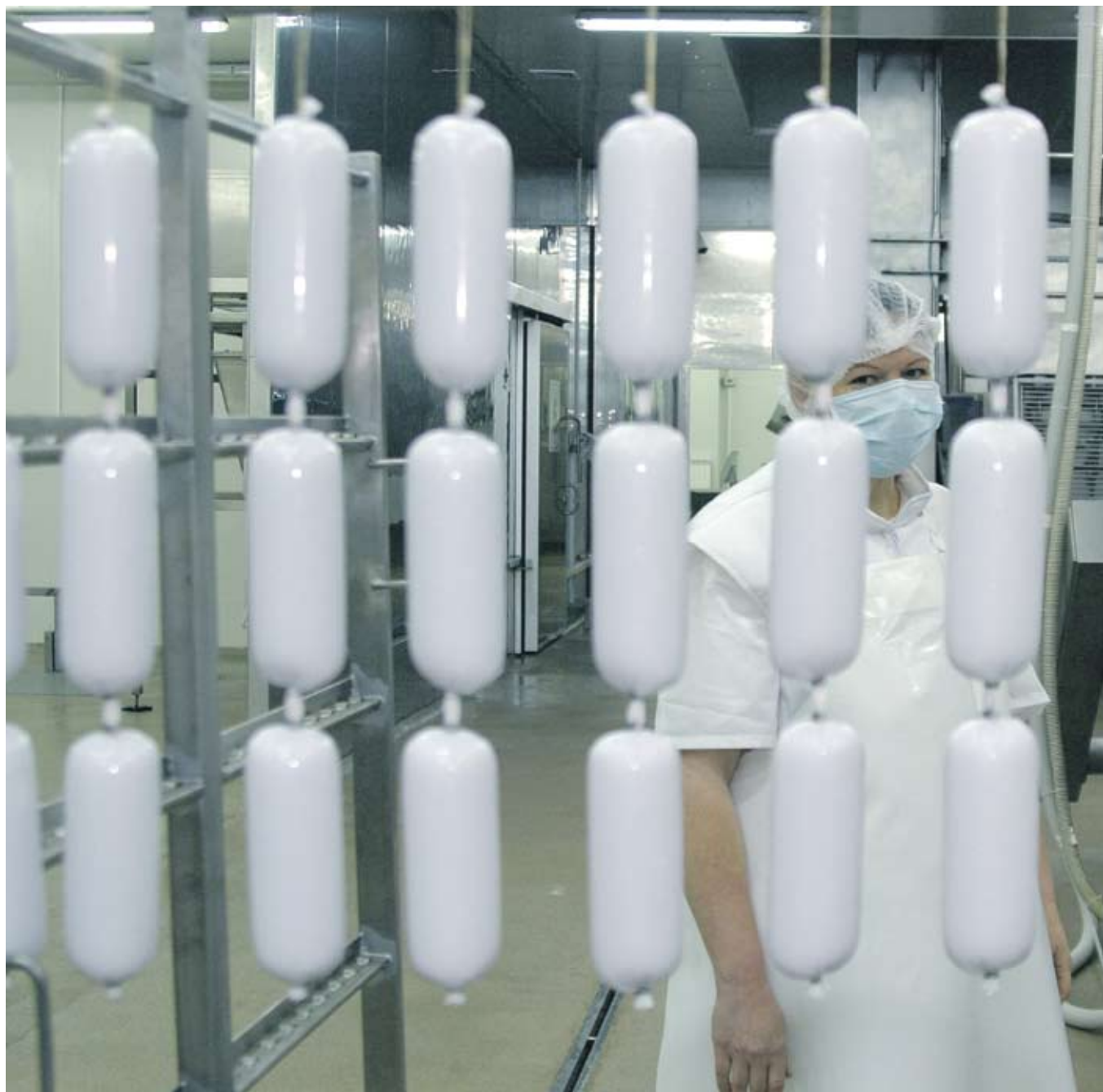
► Новите изисквания при производството на колбаси ще оскъпят продукцията, твърдят производителите