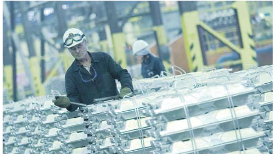
Цените на алуминия се очаква да отбележат ръст заради повишеното търсене на метала

Ако цените се върнат към предишните си нива, ще се ограничи броят на фалиралите лелярни и ще се стимулира отварянето наново на стари производствени бази. Barclays Capital прогнозира 11% ръст в продукцията през тази година до 42 млн. тона.