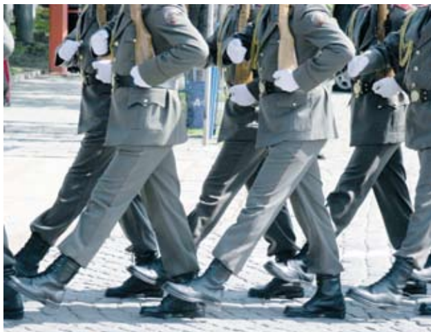
► Крайно време е да се попита какво прави контингент от над 600 български войници в Афганистан

В условия на криза правителството заделя 100 млн. лв. за мисията в Афганистан