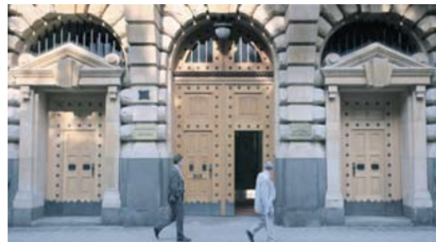
► Националната банка на Унгария остави основния лихвен процент без промяна

На 9 юни премиерът Орбан обяви, че планира да събере 187 млрд. HUF (825 млн. USD) от специален данък върху финансовите институции с цел намаляване на дупката в бюджета от 4% през миналата година до 3.8% от БВП. Правителството обяви и замразяване на 40 млрд. HUF държавни разходи във всичките осем министерства и няколко държавни агенции, твърди официалният вестник Magyar Kozlony. Кабинетът планира да спести и 120 млрд. HUF чрез замразяване на други държавни харчения и намаляване на заплатите в държавния сектор с 15%. Мерките бяха одобрени от МВФ и ЕС, които отпуснаха 20 млрд. USD заем на страната през 2008 г.