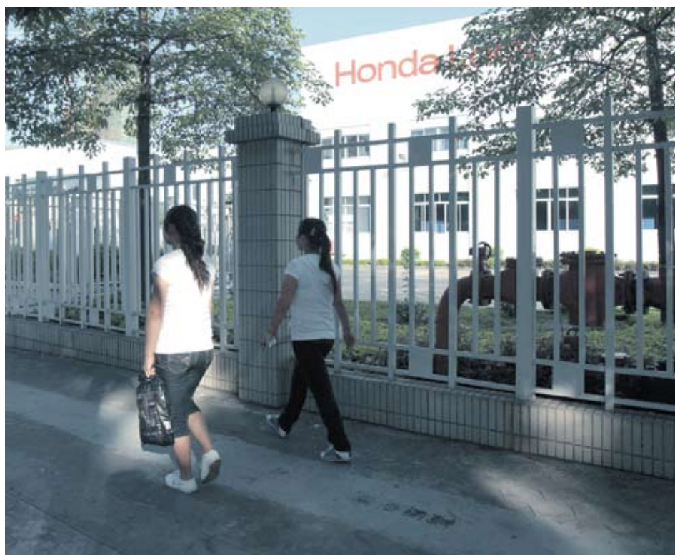
▶ Работниците на Honda се върнаха на работните си места, след като компанията се съгласи да увеличи заплатите

Минималната заплата тази година е била увеличена в повече от 20 провинции и града в Китай, показват официални данни. Според правителството ръстът на заплащането в Шънжън със средно 15.8% ще улесни компаниите в наемането на работници и ще повиши потреблението. Това е част от идеята за преминаване към икономика, движена от вътрешното потребление, смятат наблюдатели.